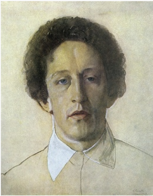
А. А. Блок. Портрет работы К. А. Сомова. 1907. Третьяковская галерея (Москва).