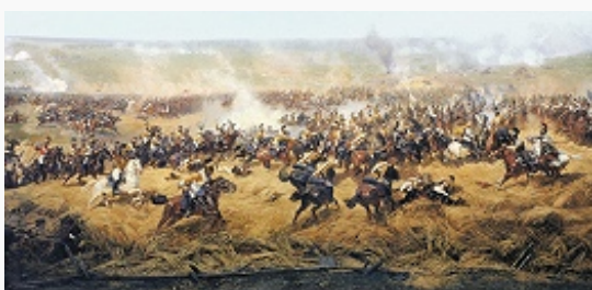
«Кавалерийский бой во ржи». Фрагмент панорамы «Бородинская битва». Художник Ф. А. Рубо. 1910–12. Музей-панорама «Бородинская битва» (Москва).

атакой 5-й корпус ген. Ю. Понятовского занял дер. Утица и попытался обойти левый фланг рос. армии, но рос. 3-й пехотный корпус ген.-л. Н. А. Тучкова при поддержке переброшенных по приказу М. И. Кутузова частей 2-го пехотного корпуса ген.-л. К. Ф. Багговута сорвал обходной манёвр противника. Тогда же Наполеон I приказал 4-му корпусу Богарне атаковать батарею Раевского: первая атака франц. войск была отражена, в результате второй атаки им удалось овладеть батареей, но они были выбиты контратакой рос. войск. К полудню, после упорных боёв и с большими потерями, франц. войска овладели Семёновскими флешами. П. И. Багратион был тяжело ранен. Сменивший его ген.-л. П. П. Коновницын отвёл поредевшие части 2-й армии за дер. Семёновское. У французов на правом крыле был значит. перевес в силах, Кутузов расходовал резервы по частям, направив на левое крыло рос. армии недостаточно