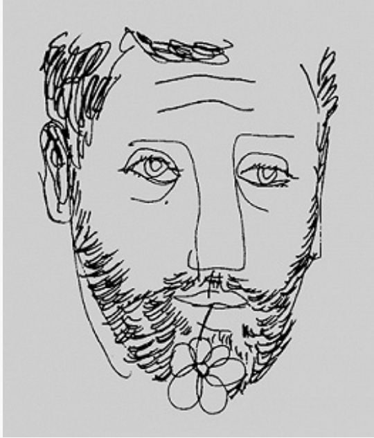
И. А. Бродский. Автопортрет.

теоретич. высказываниях, в т. ч. в Нобелевской речи, Б. развивает мысль о