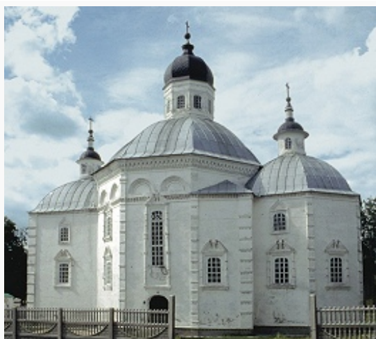
Церковь Рождества Христова в Стародубе. Кон. 17 в.

К древнейшим археологич. находкам на территории Б. о. относятся палеолитич. статуэтки из бивня мамонта (стоянки Хотылёво-1 и 2), Трубчевский клад 7 в. н. э., славянские и древнерусские городища 9–13 вв. с валами и рвами у современных сёл Синин, Кветунь, Вщиже и др. Раскопками открыты храмы черниговской школы архитектуры в Трубчевске и Вщиже. Первый каменный храм был возведён в сер. 16 в. в Свято-Успенском Свенском мон. С 16 в. в порубежной Б. о. шло военно-оборонит. строительство. Сохранились остатки земляной крепости в Севске, построенной по зап.-европ. образцу, укреплений в Стародубе. «Валы» в Почепе построены на месте форта с 5 бастионами, возведённого по указу Петра I в 1706–07.