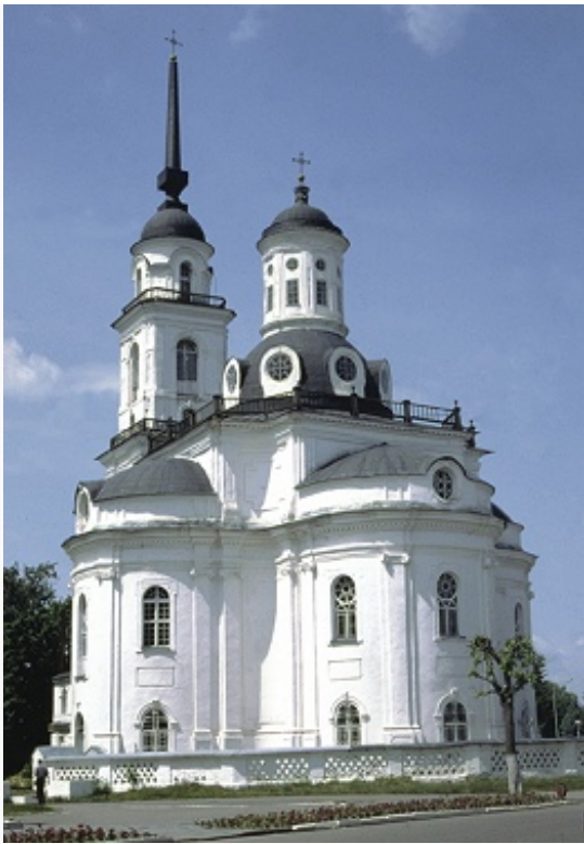
Воскресенский собор в Почепе. Нач. 1760-х гг. Архитектор А. Ринальди.

арх. А. Ринальди ; барочный иконостас предположительно выполнен по рисунку Б. Ф. Растрелли , по преданию, перенесён из церкви с. Перово под Москвой, где имп. Елизавета Петровна тайно венчалась с А. Г. Разумовским). Собор Успения Богоматери в Мглине возведён в память Отеч. войны 1812 (1815–30). Среди гражд. зданий – «каменица» 18 в. (постройка для хранения войсковой казны), гор. дома 19 в. в Трубчевске, Севске и др. Уцелел ряд памятников дерев. зодчества 17–19 вв., возведённых на основе укр. (церкви в Старом Ропске и Новом Ропске) и русских традиций (в т. ч. продолжавшихся старообрядцами). Образец дерев. ампира – ц. Николая Чудотворца в с. Синин (1826). В псевдогоthic. стиле построены ц. Преображения в с. Великая