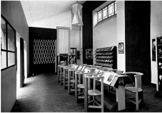
Дизайн. Интерьер рабочей читальни. Проект А. М. Родченко. Россия. 1925.

организации инфраструктуры при строительстве железных дорог, эффективности конструкций (проекты В. Г. Шухова ) и удобства пользования при создании новых видов техники (автомобилей, велосипедов, самолётов и т. д.). Так же как и в др. странах, стилю модерн предшествовал этап нац.-романтич. тенденций, в т. ч. рус. вариант движения «Искусства и ремёсла» (мастерские в Абрамцево и Талашкине ).