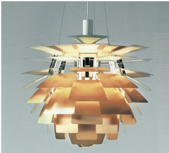
Дизайн. Лампа «Артишок» фирмы «Louis Poulsen». Дания. Дизайнер П. Хеннигсен. 1957.

Всеобщей электр. компанией (AEG) для того, чтобы придать единый характер разнообразной продукции этого гигантского концерна; он стал и одним из основателей «Немецкого Веркбунда» .