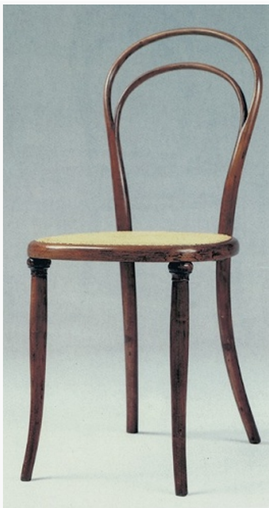
Дизайн. Стул фабрики «Tonet». Вена. 1850-е гг.

труда в доисторич. эпохи, в изделиях античных и ср.-век. мастеров. В эпоху Возрождения всё большее значение приобретает «проектный подход», создание проекта отделяется от процесса изготовления вещи. Делая наброски схем разл. устройств (геликоптеров, махолётов, подводных лодок, велосипедов, строит. механизмов и воен. машин), Леонардо да Винчи пользовался таким распространённым методом проектирования, как компоновка. Конструируя паровую машину, Дж. Уатт для наглядности обращался к специфич. разновидности проектной графики. Ту же цель – облагородить технич. устройства, придать им более гармоничный облик преследовал в своих проектах станков рос. изобретатель-художник А. К. Нартов .