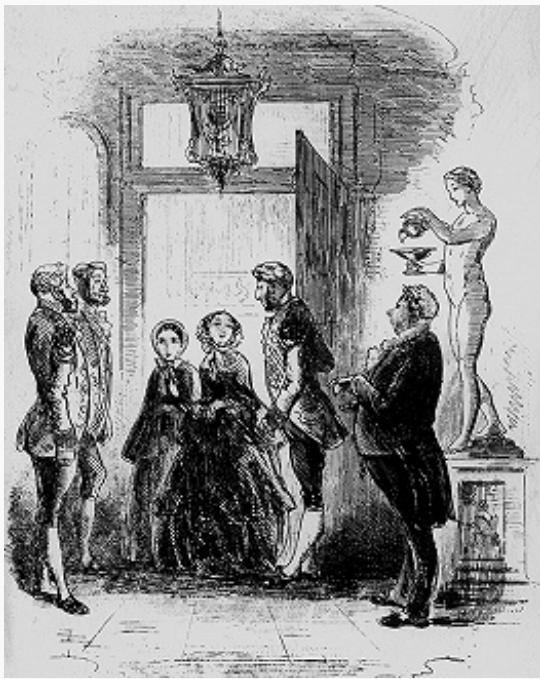
Ч. Диккенс. Фронтиспис работы Х. К. Брауна к роману «Крошка Доррит» (Лондон, 1867).

алчности взрослых, преступному миру лондонских трущоб. Др. ранние сочинения Д. – авантурный роман «Жизнь и приключения Николаса Никльби» («The life and adventures of Nicholas Nickleby», 1838–39), роман-сказка «Лавка древностей» («The old curiosity shop», 1841), идеализирующий детский характер, – построены на чётком противопоставлении положительных и отрицательных героев и также пронизаны верой в победу добра над злом. Романы Д. поначалу печатались в периодике по частям; сопровождалась иллюстрациями [наиболее известны работы Физа (Х. К. Брауна) и Дж. Крукшанка]. Сочиняя романы, Д. «опережал» читателей всего лишь