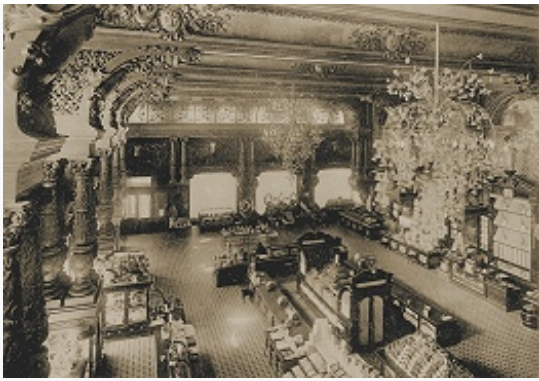
Интерьер магазина Торгового товарищества «Братья Елисеевы» в Москве. Фото. Нач. 20 в. Архив М. В. Золотарёва

купец 1-й гильдии (1883), коммерции советник (1885), тайн. сов. (1896); пред. правления С.-Петербур. частного коммерч. банка (1882–84), в 1896 вышел из семейного дела, чл. совета Учётного и ссудного банка (1896–1917), совета Гос. банка от биржевого купечества (1894–1902), совета по учебным делам Мин-ва финансов (с 1896; с 1906 совет находился в ведении Мин-ва торговли и пром-сти), совета торговли и мануфактур Мин-ва торговли и пром-сти. Его брат Григорий Григорьевич