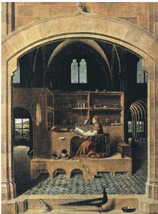
«Святой Иероним в келье».

Картина Антонелло да Мессины. Ок. 1475. Национальная галерея (Лондон).