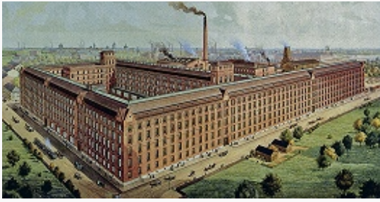
Завод Русского общества «Л. М. Эриксон и Ко» в С.-Петербурге. Рекламный плакат. Нач. 20 в.

3-й этап И. (1900–14), как и предыдущий, начался с кризиса. Оживление, наступившее в 1904, дважды прерывалось (1905, 1908), а в 1909 переросло в подъём. По темпам пром. роста он почти не уступал подъёму 1890-х гг.: в 1909–13 ср.-годовой прирост стоимости фабрично-заводской продукции составлял 10,1% (в 1894–99 – 10,3%). Однако абсолютный размер ср.-годового прироста стоимости продукции в 2,3 раза превосходил