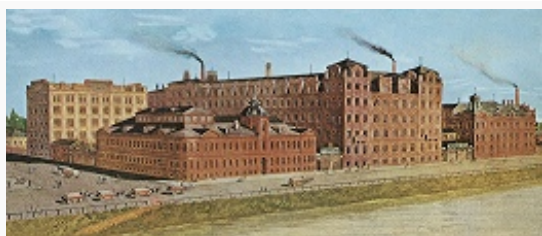
Кондитерская фабрика товарищества «Эйнем» в Москве. Общий вид. Литография. Кон. 19 в.