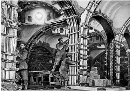
Архив БРЭ Строительство станции метро «Маяковская». Фото. 1938.

Рыночные регуляторы во внутрихозяйств. сфере и в области междунар. экономич. отношений были полностью заменены централизов. планированием (см. Пятилетние планы ) и гос. монополией на внешнюю торговлю. Установление цен также стало прерогативой центр. органов. Плановое краткосрочное кредитование нар. хозяйства сосредоточилось в Государственном банке СССР , долгосрочное – в спец. банках.