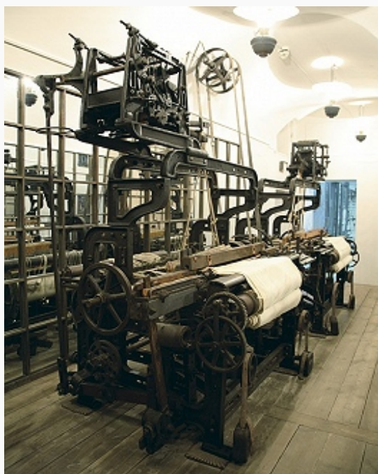
Механические ткацкие системы

На 1-м этапе И. (примерно 1830–70-е гг.) – на стадии пром. переворота – произошёл переход от ручного труда к машинному произ-ву, которое стало преобладать к нач. 1880-х гг. Сложились осн. элементы отраслевой структуры. Гл. отраслью являлось текстильное произ-во (св. \frac{1}{2} всей стоимости пром. продукции). Важное значение приобрела пищевая пром-сть (мукомольное, сахарорафинадное, маслодельное, винокуренное, табачное производства), непосредственно порождённая капиталистич. эволюцией с. х-ва. 3-е место по объёму пром. произ-ва занимали горнозаводская пром-сть и металлообработка, развитие которых было связано гл. обр. со строительством железных дорог и в значит. мере являлось результатом правительств. мер по организации обслуживавших его производств (рельсового произ-ва, а также паровозо- и вагоностроения).