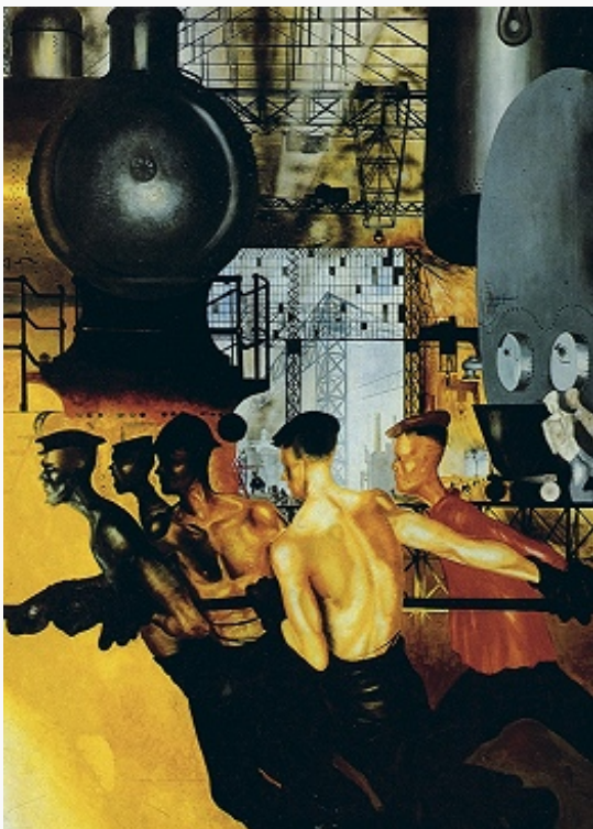
«Даёшь тяжёлую индустрию!»