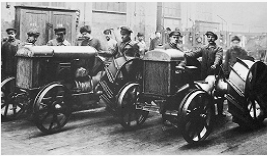
Первые тракторы завода «Красный путиловец». Ленинград. 1925.

между воен. и гражд. произ-вом посредством вне рыночного распределения гос.- монополистич. органами (Особыми совещаниями и пр.) сырья, топлива, оборудования, средств транспорта, рабочей силы и продовольствия не смогли предотвратить надвигающуюся катастрофу. Социальное напряжение, усугубившееся трудностями воен. времени, вылилось в Февр. и Окт. революции 1917.