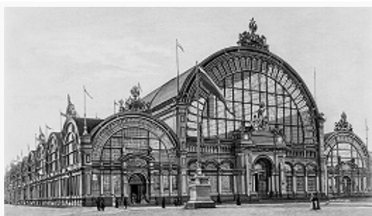
Павильон машинного отдела на Всероссийской художественно-промышленной выставке 1896 в Нижнем Новгороде. Фото.

границу экспортировались пиломатериалы, сахар, нефтепродукты, хлопчатобумажные ткани и резиновые изделия, паровозы, рельсы, марганцевая руда. В Россию в дополнение к внутр. произ-ву импортировались уголь и кокс, пром. машины (станки, двигатели) и механизмы, с.-х. машины и орудия, мор. суда и судовые двигатели, электротехнич. оборудование, цветные металлы, химич. продукты, бумага и писчебумажные изделия, часовые механизмы, автомобили и велосипеды. Оставаясь крупнейшим мировым производителем и экспортёром с.-х. продукции (зерновых, льна, яиц, сливочного масла и пр.), Россия по абсолютному объёму пром. произ-ва в нач. 20 в. входила в пятёрку крупных индустриальных держав наряду с США, Германией, Великобританией и Францией. К 1900 её доля в мировом пром. произ-ве достигла 5%. Приблизившись по этому показателю к Франции (7,1%), Россия превзошла её по выплавке стали, произ-ву машин и хлопчатобумажных тканей. Но она намного отставала от США, Германии и Великобритании. В 1913 в России произведено 5,3% мировой пром. продукции, доли остальных индустриальных держав, за исключением США, снизились. По произ-ву изделий пром-сти на душу населения Россия отставала от более передовых стран и находилась на уровне Испании, Италии и Японии. Слабо были затронуты И. вост. окраины империи. В России доход на душу населения, по подсчётам некоторых исследователей, составлял \frac{1}{3} показателей Франции и Германии и ок. 60% показателя Австро-Венгрии.