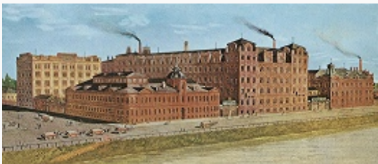
Кондитерская фабрика товарищества «Эйнем» в Москве. Общий вид. Литография. Кон. 19 в.