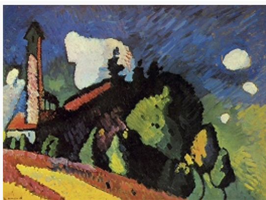
В. В. Кандинский. «Пейзаж с башней». 1908. Национальный музей современного искусства (Париж).

Исполнял также акварели, выставочные плакаты, ксилографии: «Стихи без слов» (1903, изд. 1904); книга стихотворений К. в прозе «Звуки» («Klänge») с авторскими иллюстрациями (1913). В поэзии К. соединились черты символистской и экспрессионистич. поэтики, а также футуристич. зауми . Длительные дружеские отношения, базировавшиеся на неизменном интересе К. к музыке, связывали его с А. Шёнбергом .