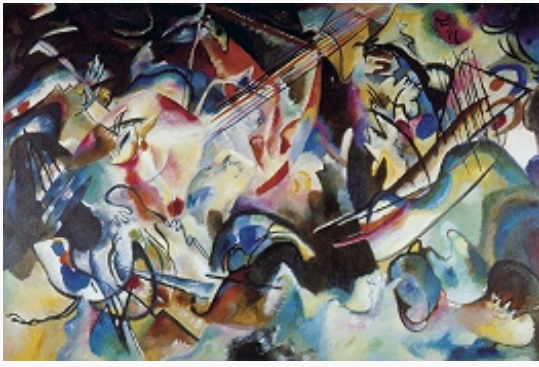
В. В. Кандинский. «Композиция VI». 1913. Эрмитаж (С.-Петербург).

(линия, цвет) являются носителями первичных смыслов; комбинации таких форм-знаков, освобождённых от предметности, образуют худож. текст, раскрывающий духовное содержание универсума. Полотна К. 1910–14 сохраняют связь с пейзажным восприятием, однако полыхания цвета, парящие формы, молниеносные росчерки ассоциативно соотносятся скорее с общими представлениями о динамич. процессах в природе – органич.