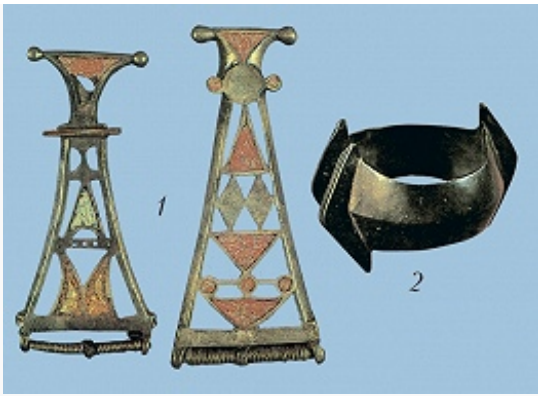
Киевская культура. Бронзовые фибулы с эмалью (1) и браслет (2) из клада на поселении Шишино 5 (по А. М. Обломскому).

землю жилища срубной или каркасной конструкции (в лесостепи изредка с глиняной обмазкой), как правило с очагами; в лесной зоне известны печи из камня, а в лесостепной – т. н. печи-камины (в нишах, вырезанных в материковой глине). Грунтовые могильники; трупосожжения на стороне; немногочисленные кости, обычно перемешанные с остатками погребального костра и обломками сосудов, помещали в круглые или овальные ямки; урны и инвентарь редки. Керамика – горшки, миски,