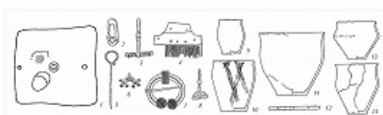
Киевская культура: 1 – план полуземлянки; 2, 3, 5–8 –

корчаги, диски, миски-плошки, миниатюрные сосуды, пряслица (как правило, биконические), грузила; при изготовлении применялся поворотный столик, есть лощёные сосуды, на раннем этапе – специально ошершавленные («хророватые»); в осн. в лесной зоне (особенно для верхнеднепровского варианта и типа Заозерье) характерна посуда, покрытая расчёсами, нанесёнными фрагментами гребня, и штрихованная. Железные серпы, проушные топоры, наконечники копий и дротиков, шпоры, иглы с ушком и др., каменные зернотёрки, на среднем и позднем этапах – ротационные жернова. Бронзовые и железные фибулы и детали поясных наборов: импортные или имитации центр.-европейских (для среднего и позднего этапа – в осн. черняховские) и местные серии. Широко распространены украшения круга восточноевропейских выемчатых эмалей , в т. ч. клады. В основе хозяйства – земледелие (подсечное или переложное) и животноводство. Сильны связи с античными городами Сев. Причерноморья и черняховской культурой , отсюда вино и др. продукты в амфорах, посуда, фибулы, гребни поступали в Ср. Поднепровье и на Днепровское Левобережье, по всей К. к. – бусы, рим. монеты и др.