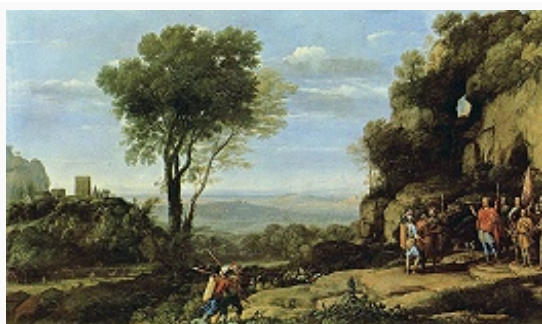
К. Лоррен. «Пейзаж с Давидом и тремя мифологическими героями». 1658. Национальная галерея (Лондон).

К. осн. элементы формы – линия и светотень; локальные цвета чётко выявляют предметы и пейзажные планы, что приближает пространственную композицию живописного произведения к композиции сценич. площадки.