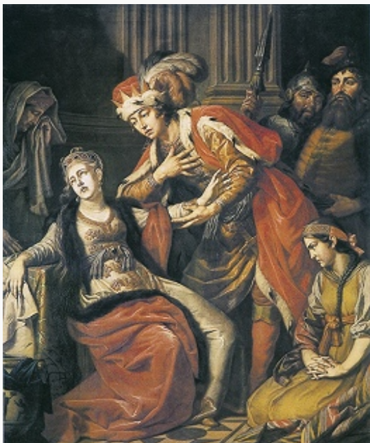
А. П. Лосенко. «Владимир и Рогнеда». 1770. Русский музей (С.-Петербург).

Во Франции в 17 в. К. сложился в мощную и последовательную худож. систему, оказал заметное воздействие на лит-ру барокко. В Германии К., возникнув как сознательное культурное усилие по созданию «правильной» и «совершенной», достойной др. европейских литератур поэтич. школы (М. Опиц ), напротив, был заглушён барокко, стиль которого больше соответствовал трагич. эпохе Тридцатилетней войны; запоздалая попытка И. К. Готшеда в 1730–40-е гг. направить нем. лит-ру по пути классицистич. канонов вызвала ожесточённую полемику и в целом была отвергнута. Самостоят. эстетич. феномен представляет собой веймарский классицизм И. В. Гёте и Ф. Шиллера . В Великобритании ранний К. связан с творчеством Дж. Драйдена ; его дальнейшее развитие протекало в русле Просвещения (А. Поуп , С. Джонсон ). К кон. 17 в. К. в Италии существовал параллельно с рококо и иногда переплетался с ним (напр., в творчестве поэтов «Аркадии» – А. Дзено , П. Метастазио , П. Я. Мартелло, Ш. Маффеи); просветительский К. представлен творчеством В. Альфьери .