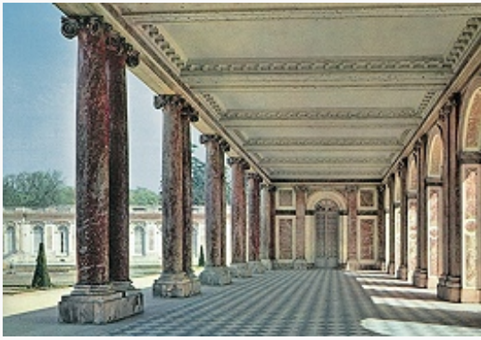
Колоннада перистиля дворца Большой Трианон в Версале. 1687. Архитектор Ж. Ардуэн-Мансар.

острополемич. взаимодействию с барокко, лишь во франц. худож. культуре сложился в целостную стилевую систему. Преим. во Франции формировался и К. 18 – нач. 19 вв., ставший общеевропейским стилем (последний в зарубежном искусствознании часто именуется неоклассицизмом). Лежащие в основе эстетики К. принципы рационализма обусловили взгляд на худож. произведение как на плод разума и логики, торжествующих над хаосом и