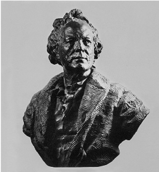
К. В. Глюк. Портрет работы Ж. А. Гудона. Гипс. 1775. Национальная библиотека (Веймар).

противоречия их интересов или принципов. Однако особое пристрастие к идеализированному выражению чувства, к благородным порывам человеческой души, пусть и далёким от строгого рационального обоснования, обеспечило исключит. популярность либретто Метастазиио на протяжении более полувека.