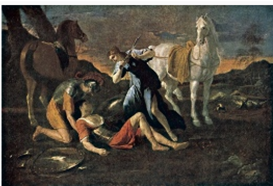
Н. Пуссен. «Танкреди Эрминия». 1630-е гг. Эрмитаж (С.-Петербург).

КЛАССИЦИЗМ (от лат. classicus – образцовый), стиль и худож. направление в литературе, архитектуре и искусстве 17 – нач. 19 вв. К. преемственно связан с эпохой Возрождения ; занял, наряду с барокко , важное место в культуре 17 в.; продолжал своё развитие в эпоху Просвещения . Зарождение и распространение К. связано с укреплением абсолютной монархии, с влиянием философии Р. Декарта , с развитием точных наук. В основе рационалистич. эстетики К. – стремление к уравновешенности, ясности, логичности худож. выражения (во многом воспринятое из эстетики Возрождения); убеждённость в существовании универсальных и вечных, не подверженных историч. изменениям правил худож. творчества, которые трактуются как умение, мастерство, а не проявление спонтанного вдохновения или самовыражения.