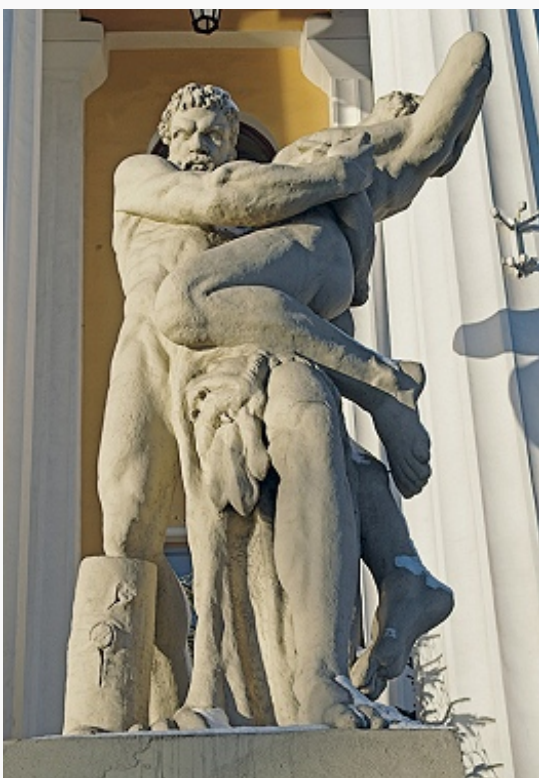
С. С. Пименов. «Геркулес,

Григорьев . Постройки 1-й трети 19 в. относятся к стилю рус. ампира (иногда именуемого александровским классицизмом ).