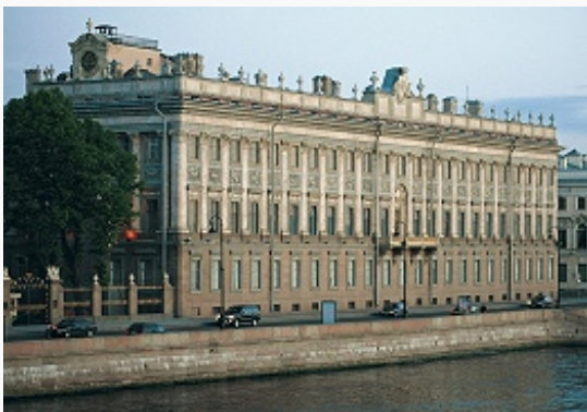
Мраморный дворец в С.-Петербурге. 1768–85. Архитектор А. Ринальди.

Расцвет К. в России относится к последней трети 18 – 1-й трети 19 вв., хотя уже нач. 18 в. отмечено творч. обращением к градостроит. опыту франц. К. (принцип симметрично-осевых планировочных систем в строительстве С.-Петербурга). Рус. К. воплотил в себе новый, небывалый для России по размаху и идейной наполненности историч. этап расцвета рус. светской культуры. Ранний рус. К. в архитектуре (1760–70-е гг.; Ж. Б. Валлен-Деламот , А. Ф. Кокоринов , Ю. М. Фельтен , К. И. Бланк , А. Ринальди ) сохраняет ещё пластич. обогащённость и динамику форм, присущие барокко и рококо.