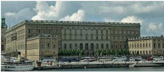
Королевский дворец в Стокгольме. 1697–1760. Архитектор Н. Тессин Младший.