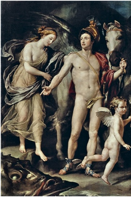
А. Р. Менгс. «Персей и Андромеда». 1774–79. Эрмитаж (С.-Петербург).