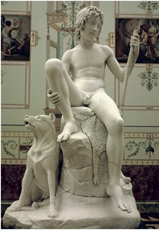
Б. Торвальдсен. «Пастух». Мрамор. 1810-е гг. Эрмитаж (С.-Петербург).

исторически сложившейся планировочной структурой старорусского города. Рубеж 18–19 вв. ознаменован крупнейшими градостроит. достижениями в обеих столицах. Сложился грандиозный ансамбль центра С.-Петербурга (А. Н. Воронихин , А. Д. Захаров , Ж. Ф. Тома де Томон , позднее К. И. Росси ). На иных градостроит. началах формировалась «классическая Москва», застраивавшаяся в период её восстановления после пожара 1812 небольшими особняками с уютными интерьерами. Начала регулярности здесь были последовательно подчинены общей живописной свободе пространственной структуры города. Виднейшие зодчие позднего моск. К. – Д. И. Жилярди , О. И. Бове , А. Г.