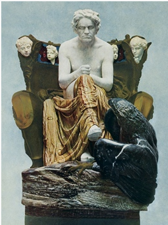
М. Клингер. «Бетховен». Алебастр, мрамор, бронза. 1899–1902. Музей изобразительных искусств (Лейпциг).

человечества получает развитие в работах К. «Голубой час» (1890, Музей изобразит. искусств, Лейпциг), «Источник» (1891–92, КГ, Дрезден), в триптихе «Воспоминание о Париже» (1908, Худож.-историч. музей, Вена). Фигуры юношей и девушек в пейзаже, то застывшие в неподвижности, то словно плывущие в медленном танце, призваны олицетворять у К. красоту воображаемого мира. Ритмика контуров, распределение цветовых пятен играют значит. роль в декоративно-плоскостном решении композиций. В триптихе «Христос на Олимпе» (1897, Музей изобразит. искусств, Лейпциг), где живопись сочетается со скульптурными орнаментальными деталями, нашла выражение идея синтеза разл. видов искусств, занимавшая важное место в эстетике символизма.