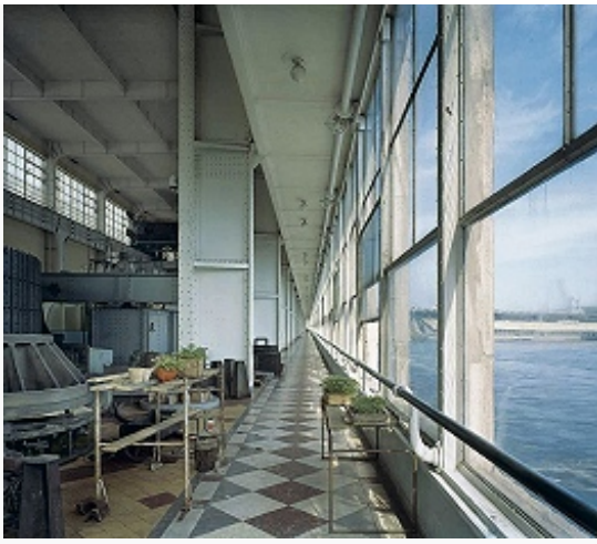
Интерьер машинного зала Днепрогэса. 1927–32. Архитекторы В. А. Веснин, Н. Я. Колли и др.