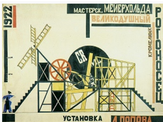
Л. С. Попова. Проект сценической конструкции для спектакля «Великодушный рогоносец» по пьесе Ф. Кроммелинка (постановка театра В. Э. Мейерхольда). 1922. Третьяковская галерея (Москва).

Ранний К. отличался агитационно-оформительской направленностью: серия проектов «Радиооператоров» Г. Г. Клуциса (1922), основанных на сборно-разборных вантово-стержневых конструкциях, применение монтажа для активизации восприятия в документальном и игровом кинематографе (Д. Вертов , Э. И. Шуб , Л. В. Кулешов ). Благодаря изданию в Берлине в 1922 новаторского по конструкции и типографике ж. «Вещь» Л. М. Лисицким и И. Г. Эренбургом термин «К.», а также характерные произведения и имена художников становятся известными и на Западе.