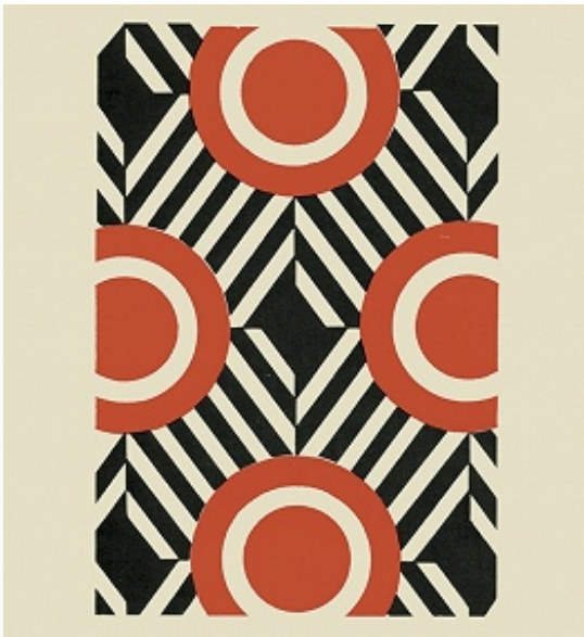
В. Ф. Степанова. Проект рисунка для ткани. 1924–25.

одежде, обнажение конструкции кроя, подчёркивание функциональных и технич. деталей (карманов, ремней, застёжек) в прозодежде (А. А. Экстер и др.). Проекты модельеров опирались на формально-геометрич. структурные построения; Н. П. Ламанова разработала систему построения костюма по плоскостям и раскрой по прямоугольной схеме.