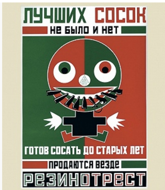
А. М. Родченко, В. В. Маяковский. Рекламный плакат для Резинотреста. 1923.