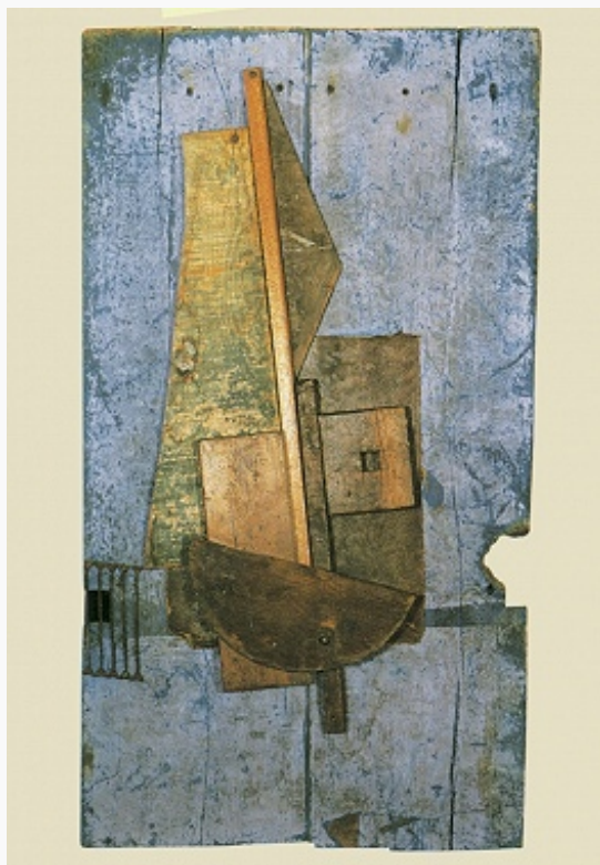
В. Е. Татлин. «Синий контррельеф». Ок. 1914. Частное собрание.

каркасной основе (по типу инж.-технич. конструкций). В 1919–20 А. А. Веснин (см. Веснины ), Л. С. Попова , А. М. Родченко создавали абстрактные живописные и графич. произведения, называя их «конструкциями» (Родченко), «живописной архитектоникой» (Попова); однако решающим было появление пространственных конструкций. В живописи изображения предметов абстрагировались, заменялись комбинациями геометрич. форм, плоскостей, линий, точек, цвета и фактуры.