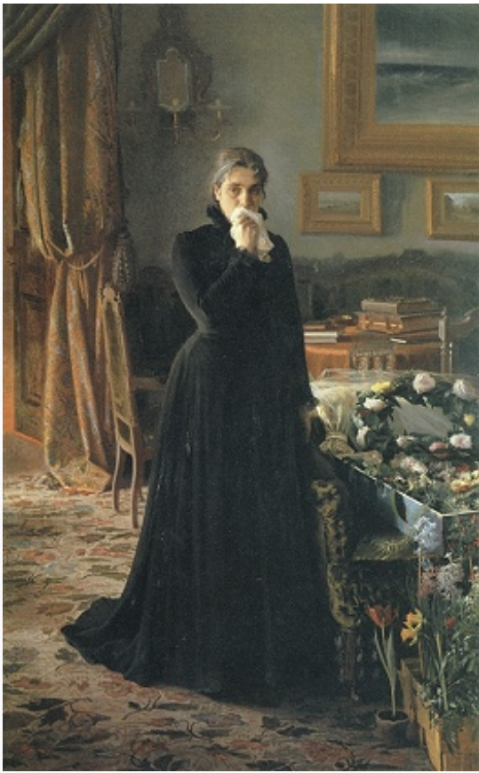
И. Н. Крамской. «Неутешное горе». 1884. Третьяковская галерея (Москва).

психологич. характеристики. Созданные К. портреты крестьян отразили внутри достоинство человека из народа, а порой и зреющий социальный протест («Полесовщик», 1874, ГТГ; «Мина Моисеев», 1882, ГРМ; «Крестьянин с уздечкой», 1883, Музей рус. иск-ва, Киев).