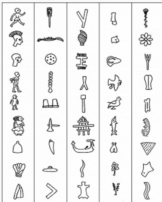
Знаки критской иероглифики класса А и класса В.

Памятники критской письменности были открыты А. Эвансом , который предложил их классификацию. Самые ранние надписи на печатях (позднее – на глиняных табличках) выполнены критской иероглификой и подразделяются на 2 класса – А и В (Б). К разряду иероглифических могут относиться и тексты, которые Эванс считал «талисманами»; в этом случае можно говорить о разновидности критской иероглифики С. Известные образцы критской иероглифики датируются начиная с 23–22 вв. до н. э., большинство из них относится к 20–17 вв. до н. э. Знаки располагаются не в линейной последовательности (кроме «талисманов»). Отдельно стоящие знаки иероглифич. печатей часто невозможно отличить от изображений (мелкой пластики). Иероглифика класса В отличается большей схематичностью знаков. Язык памятников критской иероглифики неизвестен. Краткость и немногочисленность надписей значительно сокращают возможности её дешифровки.