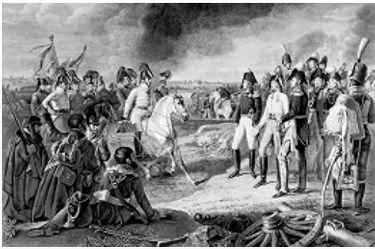
Победа при Лейпциге. Гравюра. 1820.

Поражение армии Наполеона I в Л. с. лишило Францию ряда территориальных завоеваний в Европе, привело к распаду Рейнского союза и в целом ускорило падение Наполеона. Потери франц. войск составили 60–80 тыс. чел. (в т. ч. 20 тыс. пленными) и 325 орудий, союзнич. войск – ок. 54 тыс. убитыми и ранеными (в т. ч. рос. войск – св. 22 тыс. чел., прус. войск – 16 тыс. чел., австр. войск – ок. 15 тыс. чел.).