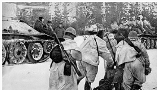
Выдвижение советских войск на исходные позиции для наступления. Фото. 1943.

удары по батареям, обстреливавшим Ленинград. В июне обстрелы города резко сократились, а к октябрю их интенсивность уменьшилась в 3–4 раза. Под Ленинградом зародилось массовое снайперское движение (указом Президиума ВС СССР от 6.2.1942 десяти лучшим снайперам Ленингр. фронта присвоено звание Героя Сов. Союза, а 130 награждены орденами и медалями), активную борьбу вели партизаны, отвлекая значит. силы врага с фронта. Попытки деблокады Ленинграда в 1942 (наступления на любанском направлении в январе – апреле и на синявинском направлении в августе – октябре) из-за недостатка сил и средств, недочётов в организации успеха не имели, однако эти активные действия сов. войск сорвали готовившийся новый штурм города. Контрнаступление сов. войск в ходе Сталинградской битвы 1942–43 вынудило герм. командование перебросить часть войск из района Ленинграда, что создало благоприятную обстановку для его деблокады.