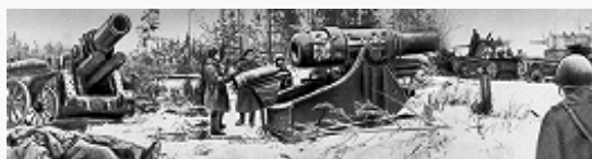
Захваченные советскими войсками фашистские дальнобойные орудия, обстреливавшие Ленинград. 1944.

Войска 67-й армии Ленингр. фронта, 2-й ударной армии и части сил 8-й армии Волховского фронта (создан 17.12.1941; команд. – ген. армии К. А. Мерецков ) при поддержке АДД, артиллерии и авиации БФ 12–30.1.1943 встречными ударами в узком выступе между Шлиссельбургом и Синявином (южнее Ладожского оз.) разорвали кольцо блокады и восстановили сухопутную связь Ленинграда со страной. Через образовавшийся коридор (шириной 8–11 км) в течение 17 сут были проложены железная дорога и автомобильная трасса, подвергавшиеся постоянным обстрелам герм. артиллерии. Попытки расширить сухопутные коммуникации