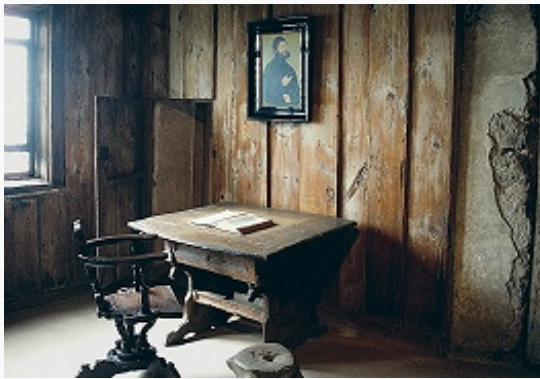
Комната в замке Вартбург, в которой работал М. Лютер.

буллу и сборник католич. канонического права. Папской буллой «Decet Romanum pontificem» от 3.1.1521 Л. был отлучён от Церкви как еретик.