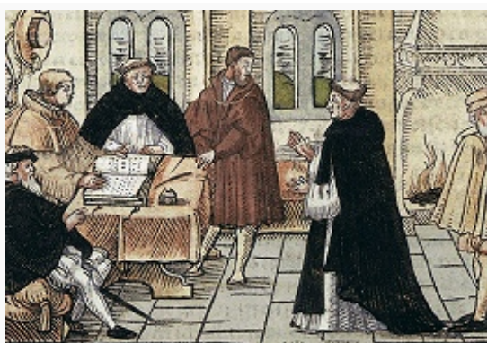
«М. Лютер перед Каэтаном». Раскрашенная гравюра. 1557.

После начала широкой продажи в Саксонии индульгенций Л. выступил против этой практики и 31.10.1517 вывесил на двери ц. Всех Святых в Виттенберге «95 тезисов о прояснении действительности индульгенций». Тем самым, по академич. обычаю, он призывал к публичному диспуту. Неожиданно для Л. его тезисы вызвали широкий резонанс, спровоцировав папского легата И. Тетцеля и архиеп. Майнцкого и Магдебургского Альбрехта, ответственных за продажу индульгенций в Германии, обратиться с жалобой в Рим, а папу Римского Льва X – инициировать процесс привлечения Л. к ответственности за ересь (лето 1518). Хотя в тот момент Л. ещё не думал о разрыве с Римско-католич. церковью, его выступление положило начало Реформации в Европе.