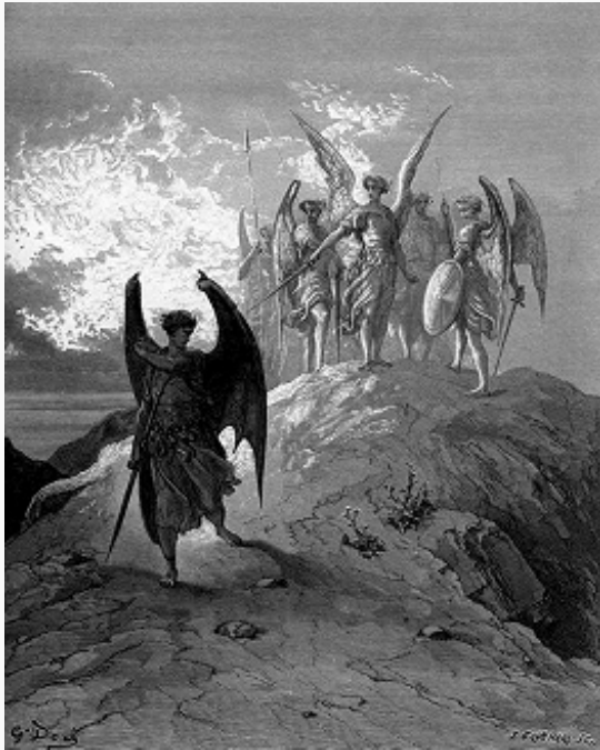
Иллюстрация Г. Доре к «Потерянному раю» Дж. Мильтона (1866).

были известны пьесы Й. ван ден Вондела на тот же сюжет – «Люцифер» (1654) и «Адам в изгнании» (1664). Поэма, продолжившая традиции эпич. поэзии античности (Гомер, Вергилий, Овидий) и Возрождения (Данте, Т. Тассо), написана в жанре христианской учёной эпопеи; она включает в себя также жанры шестоднева (рассказа о Сотворении мира), маски, оды, гимна, эклоги и т. д.