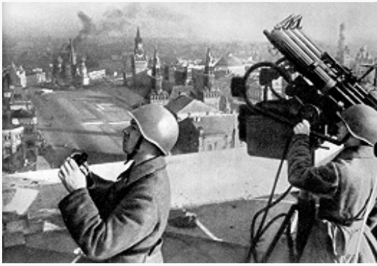
На страже московского неба.