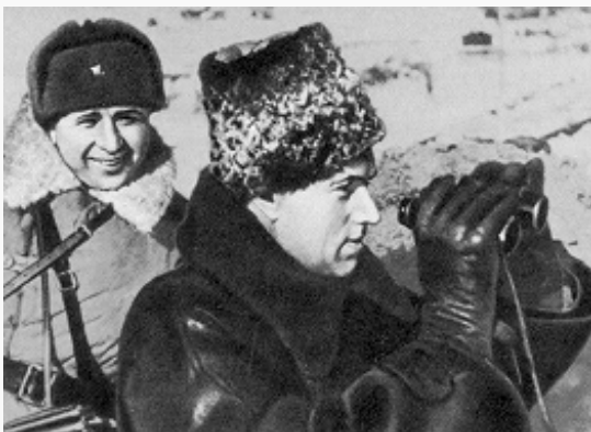
Командующий 16-й армией генерал-лейтенант К. К. Рокоссовский. Фото. Зима 1941–42.

дальнебомбардировочная авиация. Так как сов. войска понесли большие потери в оборонит. операции, Ставка ВГК в конце ноября – начале декабря передала из резерва 10-ю, 1-ю ударную и 20-ю армии на усиление Зап. фронта. Кроме того, фронт получил 9 стрелк. и 2 кав. дивизии, 8 стрелк. и 6 танковых бригад и др. Несмотря на это, сов. войска уступали германским в живой силе в 1,5 раза, в артиллерии – в 1,8, в танках – в 1,5 раза и только в самолётах превосходили в 1,6 раза. Однако командование РККА, учитывая измотанность герм. войск, отсутствие у них подготовленной обороны и оперативных резервов, их неготовность к ведению боевых действий в зимних условиях, приняло решение о проведении операции.