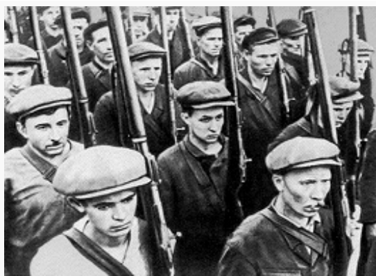
Ополченцы. Фото 1941.

Главкомандования (ВГК) состоял в том, чтобы, опираясь на выгодные рубежи, создать глубокоэшелониров. оборону, не допустить прорыва противника к столице и в Центр. пром. р-н, нанести ему возможно больший урон, выиграть время и создать условия для контрнаступления.