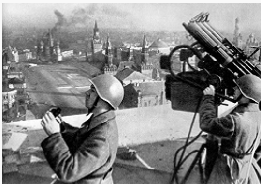
На страже московского неба.