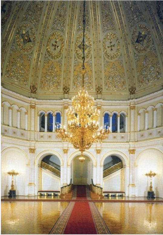
Издательство «Вэлти» Владимирский зал Большого Кремлёвского дворца. 1838–50. Архитектор К. А. Тон (реставрация 1997–99).

При отходе наполеоновской армии из Москвы в 1812 французы взорвали Успенскую звонницу и Филаретову пристройку, примыкающие к Колокольне Ивана Великого (хотя сам столп устоял), Водовзводную, Никольскую, Угловую Арсенальную башни, всю сев. часть Арсенала. Восстановит. работами занимались архитекторы О. И. Бове , Д. И. Жильярди , Ф. К. Соколов и др. В 1839–1849 взамен прежних царских и великокняжеских дворцов был возведён Большой Кремлёвский дворец в русско-византийском стиле (по проекту К. А. Тона ). Применение в его оформлении декоративных элементов 17 в. сочеталось с жёсткой позднеклассицистич. структурой планового и объёмного построения. На 1-м этаже дворца были расположены жилые покои царской семьи, 2-й этаж занимали парадные залы, убранство которых посвящалось рос.