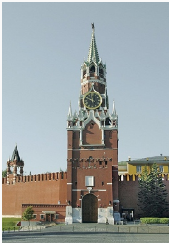
Спасская башня (до 1658 Фроловские ворота). 1491. Архитектор П. А. Солари. Надстроена в 1624–25 В. Графом. Куранты 18 в. (обновлены в 1851–52, мастера братья И. и Н. Бутенеп; ремонтировались в 20 в.)....