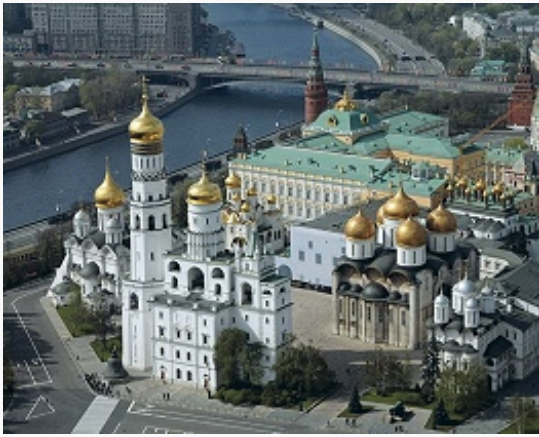
Панорама Московского Кремля с Соборной площадью.

запруженной и превращённой в широкий водный массив, с востока – т. н. Алевизовым рвом (35 м в ширину). От проездных башен через ров и р. Неглинка были перекинуты мосты; самый большой из них (каменный мост перед Ризоположенскими, или Троицкими, воротами) был дополнительно защищён Кутафьей башней. По повелению Ивана III была расчищена от застройки широкая (ок. 240 м) полоса вокруг всего М. К. – крепостной гласис.