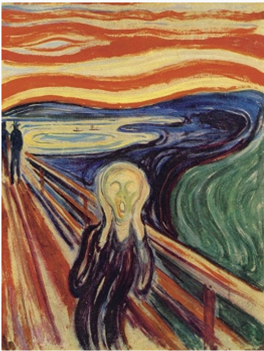
Э. Мунк. «Крик». 1893. Национальная галерея (Осло).

эротизм, отчаяние). Герои картин «Вампир» (1893, Худож. музей, Гётеборг), «Ревность» (1895, частное собрание, Берген) предстают как некие архетипы извечной драмы человеческого существования. В композициях «Крик» (1893, Нац. галерея, Осло), «Тоска» (1894, Музей Мунка), «Танец на берегу» (1900–02, Нац. галерея, Прага) линии пейзажа расходятся от человеческих фигур ритмично резонирующими импульсами, создавая ощущение психич. ауры. Интенсивные цвета, нанесённые извивающимися мазками, прорываются сквозь сумрачную тональность, наполняя её внутр. свечением. Темы «Фриза жизни» художник варьировал во многих рисунках и гравюрах («Крик», литография, 1895; «Тоска», цветная литография, 1896). Создал также фриз (серию из 12 полотен) по заказу М. Рейнхардта для театра «Каммершпильхаус» в Берлине (1907; ныне – в Новой нац. галерее, Берлин), триптих «Три возраста жизни» (1907–08; собрание Р. Мейера, Берген; Худож. музей Атенеум, Хельсинки; Музей Мунка). Иск-во М. 1890–1900-х гг., будучи ярким выражением символистской эстетики, возвещает зарождение