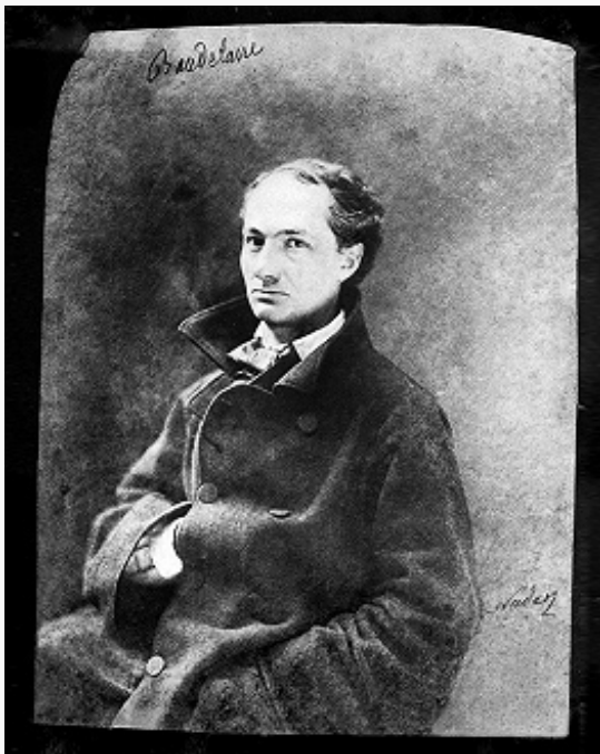
Надар. Портрет поэта Ш. Бодлера. 1855.