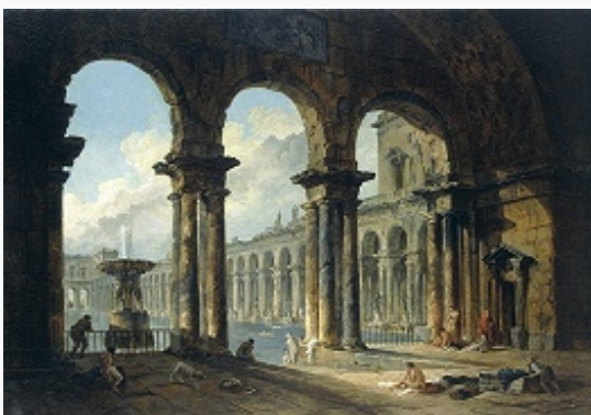
Угловая перспектива. Г. Робер. «Античные развалины, служащие общественной купальней». 1798.

изображение предмета (как правило, archit. сооружения) в ракурсе, не фронтально, а под углом. Угловую П. применял Фердинандо Галли-Биббиена , впервые описавший её в трактатах «Различные средства перспективы» (1704), «Гражданская архитектура...» (1711), а также Дж. Б. Пиранези , Ю. Робер , П. Гонзаго и др. Голл. художники 17 в. и мастера-ведутисты венецианской школы в 18 в. широко применяли прямую П., допуская её утрирование (т. н. ускоренная П. в произведениях Б. Беллотто ). Этому впечатлению способствовало использование камеры-обскуры . Различают также «военную» П. – с точкой зрения сверху, при которой линия горизонта находится вверху или за верхней границей изображения, применяемую в топографии, иногда – в иконописи (напр., в произведениях псковской школы ), станковой живописи и графике.