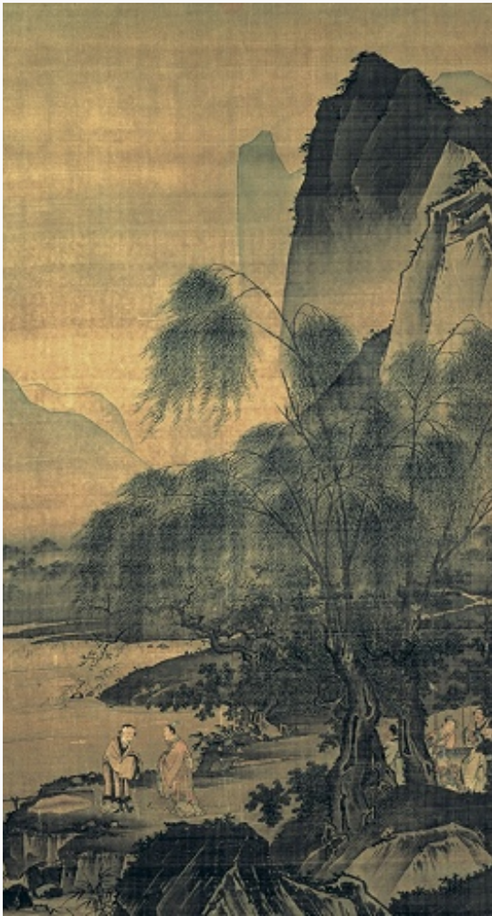
Параллельная (билатеральная) перспектива. Дай Цзинь. «Рыбалка на реке Вэй». 1-я пол. 15 в. Музей Гугун (Тайбэй).

«Оптика» (3 в. до н. э.), заложив науч. базу для теории проекций. Витрувий обосновал «виды расположения», т. е. проекции – горизонтальную (ихнография – план), фронтальную (орфография – фасад) и центральную (скенография – совр. прямая П.). Однако в худож. практике античности центр. проекция в строгом смысле слова не применялась, её заменяла т. н. рыба́ья кость – схождение линий к нескольким точкам схода на вертикальной оси. Как правило, изображение предметов в неглубоком пространстве представляло собой совокупность аксонометрий.