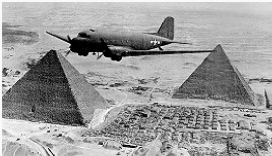
Американский транспортный самолёт С-47 выполняет задание в Египте. 1943.

большое влияние на дальнейший ход всей В. м. в. Она подорвала престиж Германии в глазах её союзников, породила у самих немцев сомнение в возможности победы в войне. Красная Армия, захватив стратегич. инициативу, развернула общее наступление на сов.-герм. фронте. Началось массовое изгнание врага с территории Сов. Союза. Курской битвой 1943 и выходом на Днепр был завершён коренной перелом в ходе Вел. Отеч. войны. Битва за Днепр 1943 опрокинула расчёты противника на переход к затяжной позиционной оборонит. войне.