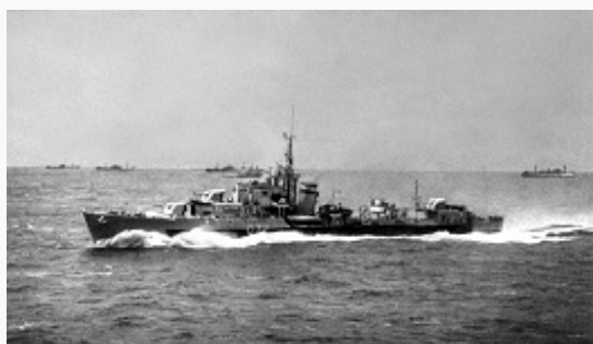
Конвой союзников возвращается из северных портов СССР. Фото 1944.

Четвёртый период войны (январь 1944 – май 1945) начался новым наступлением Красной Армии. Сов. войска в 1944 на всём сов.-герм. фронте обрушили на врага сокрушит. удары и изгнали захватчиков из пределов Сов. Союза. В ходе последующего наступления ВС СССР сыграли решающую роль в освобождении Польши, Чехословакии, Югославии, Болгарии, Румынии, Венгрии, Австрии, сев. районов Норвегии, в выводе из войны Финляндии, создали условия для освобождения Албании и Греции. Вместе с РККА в борьбе против нацистской Германии принимали участие войска Польши, Чехословакии, Югославии, а после заключения перемирия с Румынией, Болгарией, Венгрией – и воинские части этих стран. Союзные войска, проведя «Оверлорд» операцию , открыли второй фронт и начали наступление в Германии.