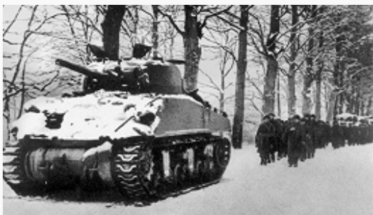
Войска союзников в Арденнах. Декабрь 1944.