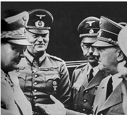
Военные руководители Германии в 1941 (слева направо): Г. Геринг, В. Кейтель, Г. Гиммлер и А. Гитлер.

10.6.1940 вступила в войну на стороне Германии Италия (в 1939 её ВС насчитывали св. 1,7 млн. чел., ок. 400 танков, ок. 13 тыс. арт. орудий и миномётов, ок. 3 тыс. самолётов, 154 боевых корабля осн. классов и 105 ПЛ). Итал. войска в августе захватили Брит. Сомали, часть Кении и Судана, в сентябре вторглись из Ливии в Египет, где были остановлены и в декабре разбиты брит. войсками. Попытка итал. войск в октябре развить наступление из оккупиров. ими в 1939 Албании в Грецию была отражена греч. армией. На Дальнем Востоке Япония (к 1939 в составе её ВС находилось св. 1,5 млн. чел., св. 2 тыс. танков, ок. 4,2 тыс. арт. орудий, ок. 1 тыс. самолётов, 172 боевых корабля осн. классов, в т. ч. 6 авианосцев с 396 самолётами, и 56 ПЛ) заняла юж. районы Китая и оккупировала сев. часть франц. Индокитая. Германия, Италия и Япония 27 сент. заключили Берлинский (Тройственный) пакт (см. Пакт трёх держав 1940 ).