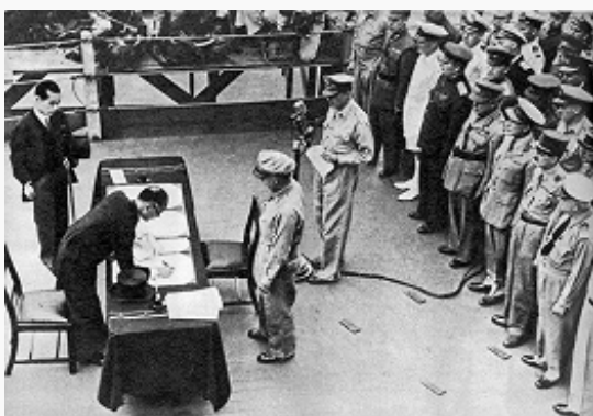
Представитель Японии министр иностранных дел М. Сигемицу подписывает Акт о капитуляции. Сентябрь 1945.

В. м. в. явилась крупнейшим воен. столкновением в истории человечества. Она длилась 6 лет, численность населения участвовавших государств составила 1,7 млрд. чел., в рядах ВС находилось 110 млн. чел. Воен. действия велись на территории Европы, Азии, Африки, в Атлантическом, Тихом, Индийском и Сев. Ледовитом океанах. Она была самой разрушительной и кровопролитной из войн. В ней погибло св. 55 млн. чел. Ущерб от уничтожения и разрушения материальных ценностей на территории СССР составил ок. 41% потерь всех стран, участвовавших в войне. Сов. Союз вынес на себе осн. тяжесть войны, понёс наибольшие человеческие жертвы (погибло ок. 27 млн. чел.). Большие жертвы понесли Польша (ок. 6 млн. чел.), Китай (св. 5 млн. чел.), Югославия (ок. 1,7 млн. чел.) и др. государства. Сов.-герм. фронт был гл. фронтом В. м. в. Именно здесь была сокрушена воен. мощь фашистского блока. В разные периоды на сов.-герм. фронте действовало от 190 до 270 дивизий Германии и её союзников. Британо-амер. войскам в Сев. Африке в 1941–43 противостояли от 9 до 20 дивизий, в Италии в 1943–1945 – от 7 до 26 дивизий, в Зап. Европе после открытия второго фронта – от 56 до 75 дивизий. Советские ВС разгромили и взяли в