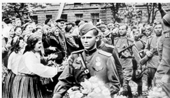
Воины 8-го стрелкового Эстонского корпуса вступают в Таллин. Сентябрь 1944.