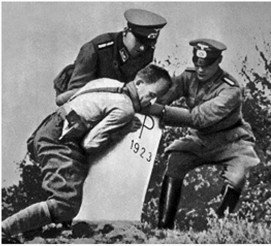
Гитлеровцы уничтожают пограничный знак на германо-польской границе. 1939.

ВС Германии достигла св. 4 млн. чел., на вооружении находилось ок. 3,2 тыс. танков, св. 26 тыс. арт. орудий и миномётов, ок. 4 тыс. самолётов, 100 боевых кораблей осн. классов. Польша имела ВС численностью ок. 1 млн. чел., на вооружении которых находилось 220 лёгких танков и 650 танкеток, 4,3 тыс. арт. орудий, 824 самолёта. Великобритания в метрополии имела ВС численностью 1,3 млн. чел., сильные ВМС (328 боевых кораблей осн. классов и св. 1,2 тыс. самолётов, из них 490 в резерве) и ВВС (3,9 тыс. самолётов, из них в резерве 2 тыс.). ВС