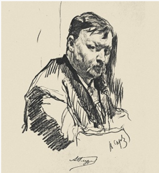
А. К. Глазунов. Портрет работы В. А. Серова. Литография. 1899.

ГЛАЗУНОВ Александр Константинович [29.7(10.8).1865, С.-Петербург – 21.3.1936, Нёйи-сюр-Сен, близ Парижа; в 1972 прах перенесён в некрополь Александро-Невской лавры в Ленинграде], рос. композитор, дирижёр, педагог, нар. арт. Республики (1922). Из семьи книгоиздателей Глазуновых . В 1883 окончил 2-е реальное уч-ще в С.-Петербурге. Получил домашнее муз. образование, с 1879 занимался у М. А. Балакирева и Н. А. Римского-Корсакова , оказавшего определяющее влияние на формирование Г. как композитора. Успех 1-й симфонии, исполненной под упр. Балакирева