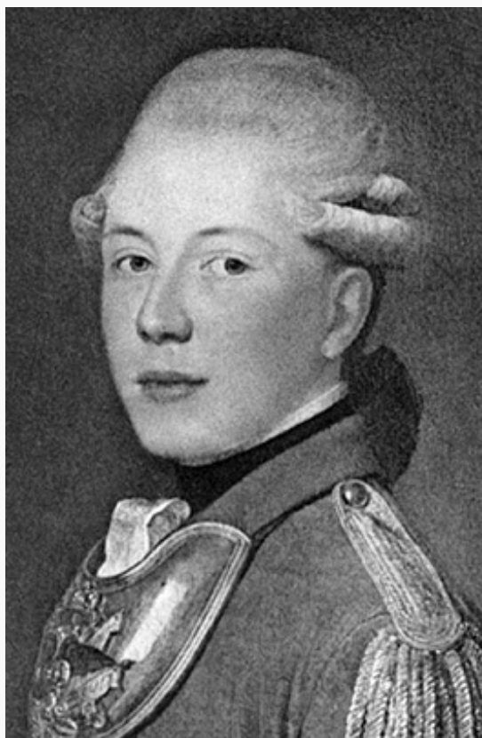
Андрей Иванович Вяземский. Гравюра с портрета работы художника Ж. Л. Вуаля.

Потомок Ивана (Меньшого) Ф. Вяземского в 8-м поколении – Николай Григорьевич [3(14).1.1769–2(14).12.1846], тайн. сов. (1797), сенатор (1804). По-видимому, к этой же линии рода В. принадлежал Сергей Сергеевич [1(13).3.1869–12(25).9.1915], контр-адмирал (1915, посм.); в 1897–1912 служил на Тихоокеанском флоте, во время рус.-япон. войны 1904–05 в качестве старшего офицера крейсера «Жемчуг» участвовал в Цусимском сражении 1905 . Ком. транспорта «Шилка» (1906–08), крейсера «Жемчуг» (1908–09), 2-го (1909–10) и 1-го (1910–12) дивизионов Минной бригады Владивостокского отряда. С 1912 на Балт. флоте, ком. линейных кораблей «Император Александр II» (1913–14), «Слава» (1914/15–1915), убит во время арт. дуэли «Славы» с герм. полевыми батареями у мыса Рагоцем (посм. награждён Георгиевским оружием). Из этой же линии, вероятно, происходит и Николай Александрович [14(26).11.1857–24.6.1925], вице-адм. (1916), ком. императорских яхт «Царевна» (1899–1908) и «Полярная звезда» (1908–16), чл. Адмиралтейств-совета (1916).