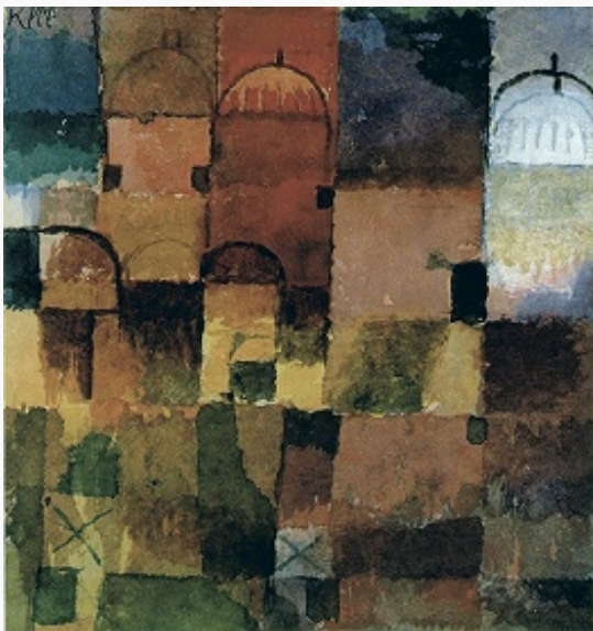
П. Клее. «Красные и белые купола». Акварель. 1914. Художественное собрание земли Северный Рейн-Вестфалия (Дюссельдорф).

Баухаузе (в Веймаре и Дессау), где руководил переплётной мастерской, а затем мастерской живописи по стеклу. К. разработал оригинальную теорию формообразования, основанную на представлении о единстве законов, управляющих процессами морфогенеза в природе и в худож. творчестве; изложил её в кн. «Пути изучения природы» («Wege des Naturstudiums», 1923), вытекающие из неё методы построения динамически развивающейся формы обобщил в «Книге педагогических эскизов» («Pädagogisches Skizzenbuch», 1925). В 1924 К. вступил в основанное В. В. Кандинским худож. объединение «Синяя четвёрка» (наряду с А. Г. Явленским и Л. Фейнингером ).