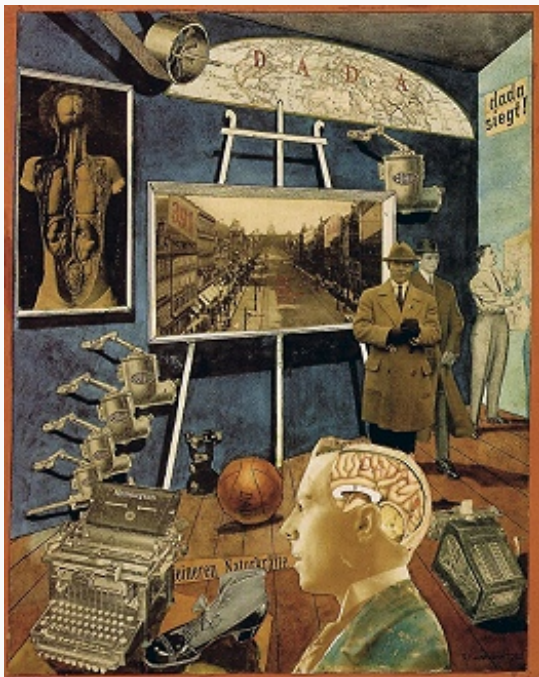
Р. Хаусман. «Дада побеждает!». 1920. Частное собрание (Нью-Йорк).

произведений, культивируя случайность; прибегали к приёмам пародии и разрушения худож. формы. В области изобразит. искусства эти тенденции проявились в реди-мейд М. Дюшана, перерисовках технич. чертежей в полотнах Ф. Пикабиа, коллажах К. Швиттерса и Х. Арпа.