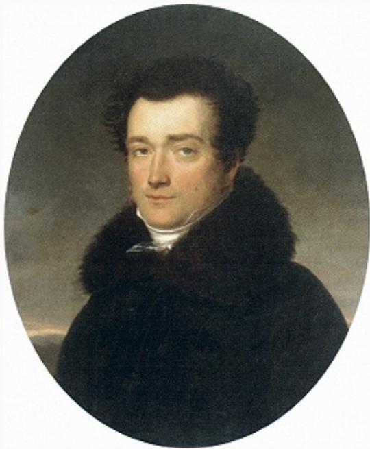
А. Д. Олсуфьев. Портрет работы А. Ф. Ризенера. 1817–18. Историко-архитектурный, художественный и археологический музей «Зарайский кремль».

обучения владению оружием в нашей кавалерии» (1904), «Пособия к управлению парусными судами и плаванию на них. Для моряков-любителей» (1909).