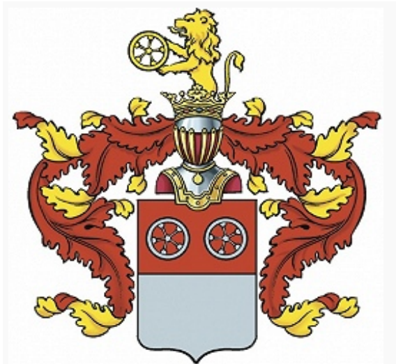
Герб дворянского рода Олсуфьевых.

ОЛСУФЬЕВЫ, рус. дворянский и графский род.