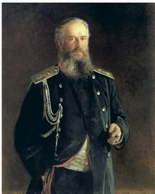
Граф Адам В. Олсуфьев (1833–1901). Портрет работы Н. Н. Ге. 1881. Русский музей (С.-Петербург).

1905) Имп. Гл. квартиры, ген.-м. Свиты Е. И. В. (1891), ген.-адъютант (1896), зав. придворной частью в Москве и нач. Моск. дворцового управления (1905–07).