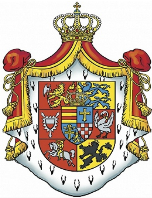
Герб графского рода Олсуфьевых.