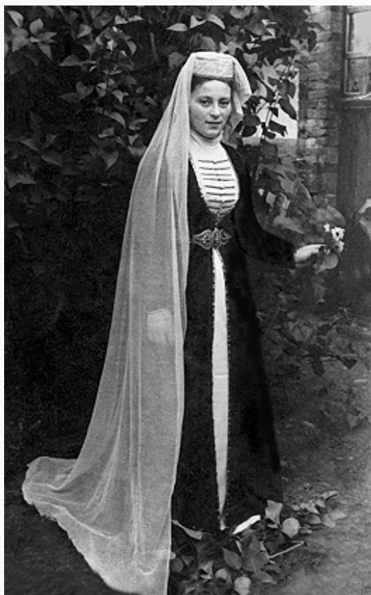
Осетинка в праздничной одежде.