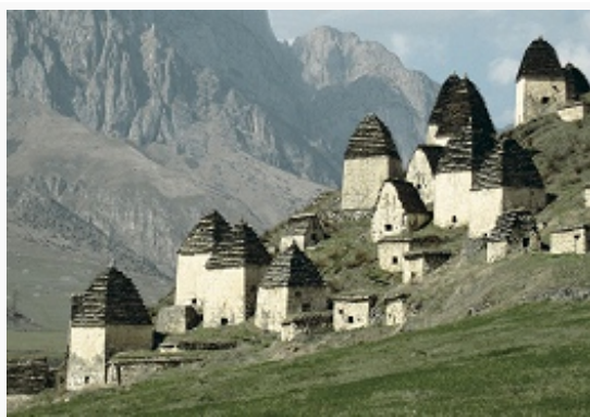
Даргавский «город мёртвых».

амцадис, галамбал), гостеприимства, побратимства, аталычества, кровной мести и выкупа. Выделялись феод. сословие (алдары, баделяты, царгасаты, гагуаты и др.; местами осет. феодалы выплачивали дань кабард. князьям, в Южной Осетии – груз. князьям), разл. категории крестьян; получило распространение домашнее рабство. Существовали экзогамные патронимич. группы и большие семьи (бинота) во главе со старшим мужчиной (хицау). Роды в прошлом имели свою тамгу (дамга). Практиковалась полигиния; за жену выплачивался выкуп (ирад), бытовало умыкание. Система терминов родства бифуркативно-линейного типа с преобладанием описат. конструкций. Сиблинги делятся по полу, а также на единокровных и единоутробных. Свадьбе предшествуют сватовство и сговор (фидыд). В день свадьбы устраиваются пиры в домах жениха (чындзхаст) и невесты (чызгарвыст). Невесту привозит и вводит в новый дом шафер (кухыл хацаг); при этом родным жениха подносится пирог (гуыдын) и др. дары, невеста угощает из особой чаши (мыдыкъус) свекровь и старших женщин смесью мёда и топлёного масла. Затем один из молодых соседей или родственников жениха (хуызисаг) снимает с невесты фату (хуызист) и трижды описывает над её головой круг особым белым флажком (сарызады хацъил), который затем хранят в потаённом месте. Жених видит невесту только на следующий день свадьбы.