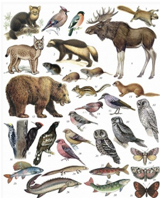
Типичные представители животного мира зоны тайги: 1 – соболь; 2 – свиристель; 3 – обыкновенный снегирь; 4 – лось (сохатый); 5 – обыкновенная летяга; 6 – рысь; 7 &nd...

породы. Вспышки массового размножения некоторых из них могут приводить к существенному повреждению или даже гибели лесных насаждений на больших площадях. Особенно опасными вредителями российских хвойных лесов являются сибирский шелкопряд, серая лиственничная листовёртка, большой и малый еловые усачи, короед-типограф; лиственные породы повреждаются непарным шелкопрядом, дубовые насаждения – зелёной дубовой листовёрткой и т. д. Разнообразие вредителей с.-х. культур, насчитывающих более 5 тыс. видов (половина из них чешуекрылые и жесткокрылые), также подвержено резким зональным изменениям. Многие виды расселяются к северу вслед за культивируемыми растениями, но наиболее велики их разнообразие и вредоносность в южных и особенно засушливых регионах страны.