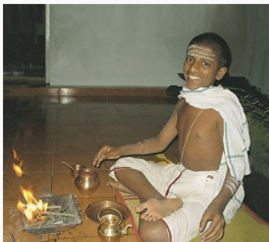
Молодой брахман во время совершения пуджи. Фото. Нач. 21 в.

другими странствующими проповедниками- шраманами ; возникло противостояние учений, признающих и не признающих значение вед ( астика-настика ).