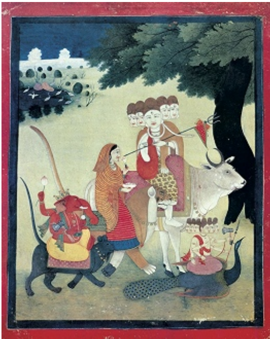
«Святое семейство» шиваизма: Шива, Парвати, Ганеша, Муруган. Музей Ритберг (Цюрих).

В повседневной жизни индуиста бог выступает как помощник и покровитель, обеспечивающий благоденствие. Верующий, вознося молитвы осн. богу той ветви И., к которой он принадлежит по рождению, не забывает других богов. Существуют боги, любимые практически всеми индуистами: играющий роль посредника между людьми и богами слогоголовый сын Шивы Ганеша , прославленные герои «Рамаяны» Рама и Хануман. Часто боги отвечают за отд. стороны жизнедеятельности человека; напр., к Ганеше обращаются ради успеха начинания или в начале путешествия, богиня Лакшми сопутствует накоплению богатства, Индру просят о своевременных дождях и хорошем