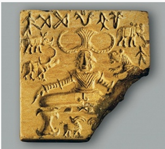
Изображение рогатого бога в

И. в осн. своих чертах сформировался к сер. 1-го тыс. н. э., впитав в себя многочисл. элементы религий разл. народов на территории Индии (см. Индийцы ) и пройдя длительный путь развития, прослеживаемый от религии индской цивилизации Мохенджо-Даро и Хараппы в 3–2-м тыс. до н. э. через ведийскую религию (сер. 2-го – сер. 1-го тыс. до н. э.) и брахманизм (7 в. до н. э. – 4 в. н. э.).