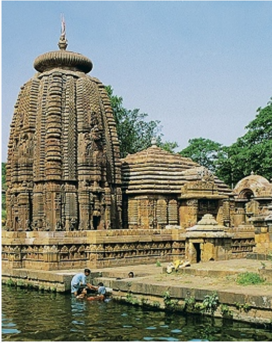
Храм Муктешвара (ок. 950) в городе Бхубанешвар (штат Орисса).

Храм в И. – место, где рождается и живёт бог; строение в целом и все его части исполнены символич. значения. Напоминающий каменный конус или пирамиду, храм представляет собой космич. гору Меру, которая олицетворяет Вселенную и одновременно является её центром, осью. С горой связано представление о пещере, ведущей в святая святых храма – помещение, где находится главное изображение бога. Пещера ведёт к центру горы, символически – к истокам, началу, зародышу; святилище храма понимается как материнское чрево и называется «гарбхагриха» («дом зародыша»). Формы и размеры индуистского храма чрезвычайно