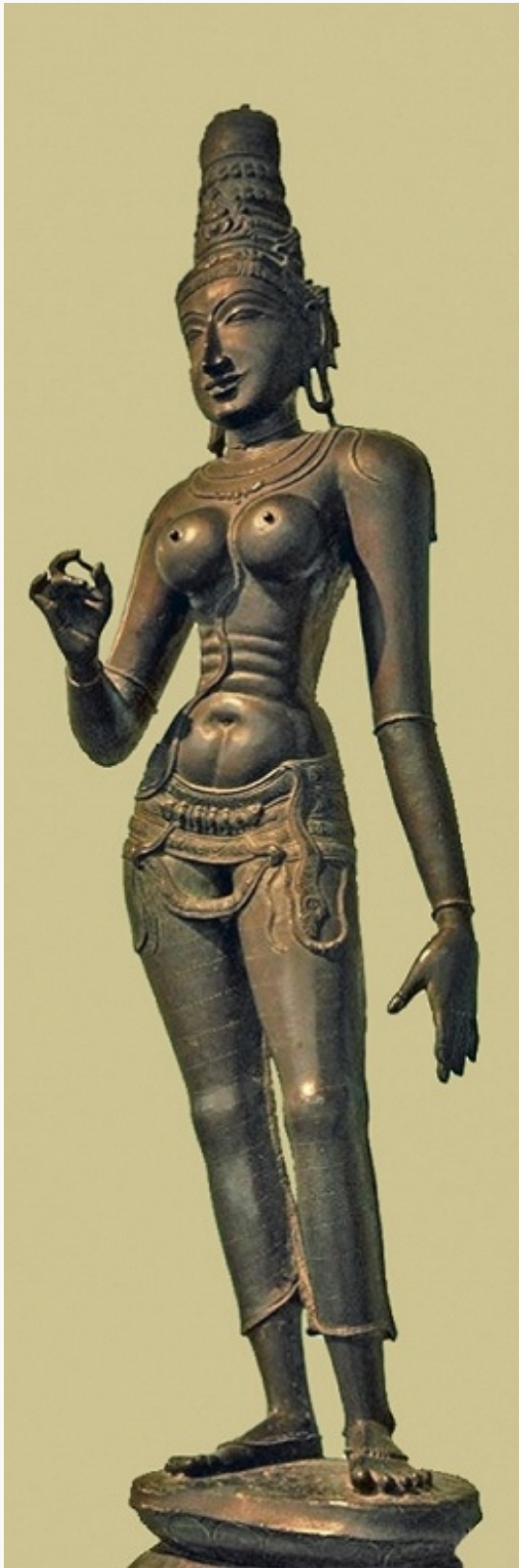
Девы. 15 в. Южная Индия. Национальный музей (Нью-Дели).