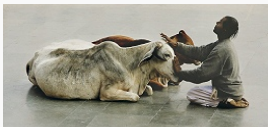
Молитвенное обращение к священным коровам в индуистском храме (Индия). Фото. Нач. 21 в.

соблазнительных женщин. Всех таких существ обобщённо называют «девата» или «грамадевата» (божества, сельские божества). Они охраняют территории деревень, борются с демонами, обеспечивают приход дождей и хорошие урожаи, следят за скотом, лечат больных и т. п. Почитают сверхъестественных персонажей более высокого ранга, имеющих свою развитую мифологию и отвечающих за благополучие крупных территорий, а также героев, предков, йогинов-чудотворцев. Делают приношения и злым духам, чтобы они смягчились и не причиняли вреда: ракшасам (оборотням и людоедам, обычно живущим в лесу), пишачам (упырям-людоедам, обитающим на кладбищах), дакини (злым уродливым демоницам, спутницам ужасной богини Кали) и др.