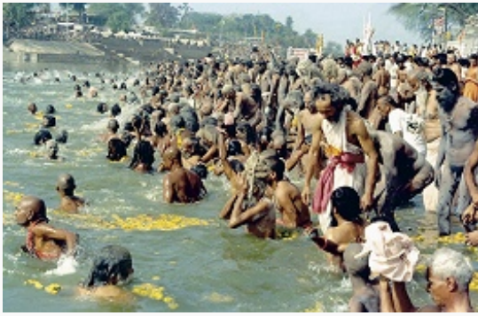
Кульминация Кумбха Мелы. 1992. Омовение в реке Сипра (город Удджайн, штат Мадхья-Прадеш).

сборище») – древний и самый крупный религ. праздник в мире, проводимый 1 раз в 12 лет (в Кумбха Меле 2001 приняли участие ок. 50 млн. чел.). Его включение в культовую практику связано с мифологич. эпизодом пахтанья океана богами для извлечения из него горшка (кумбха) с напитком бессмертия – амритой. Из- за этого напитка богам пришлось сразиться с демонами-асурами; во время битвы напиток расплёскивался из горшка, и места падения