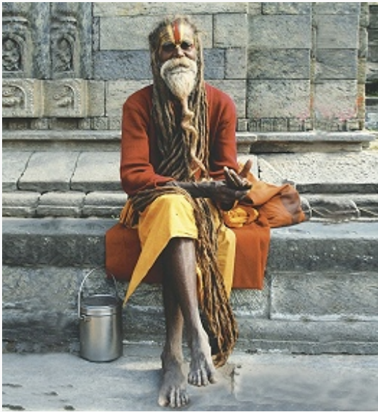
Странствующий аскет (Непал).