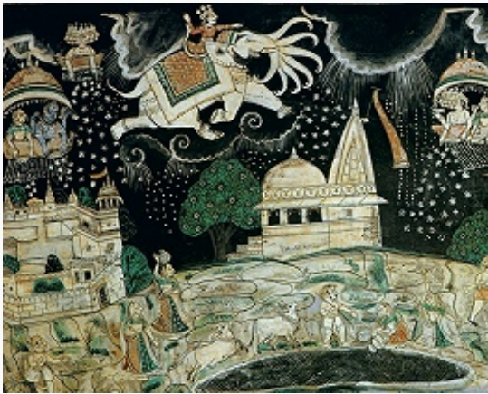
Боги на свадьбе Рамы и Ситы. Индра восседает на белом слоне. Фреска 18 в. из Бунди (штат Раджастан).

В центре ведийской религ.-мифологич. системы находился миф о борьбе молодого бога-царя Индры с демонич. змеем Вритрой, которого Индра победил ударом громовой дубины ( ваджра ), результатом чего стало возникновение Вселенной, хаос сменился космич. порядком ( рита ). Этот вариант индоевропейского змееборческого мифа задавал одну из основных для мифологии И. моделей (борьба богов и асур , их постоянных соперников и врагов). Индра стал самым популярным ведийским богом, к нему чаще всего обращались за поддержкой, просили о воен. победах и процветании. Он властвовал над небесной сферой (которую называли «мир Индры») – своего рода раем, куда отправлялись души умерших ариев (прежде всего воинов) и где они наслаждались песнями небесных музыкантов (гандхарвов) и плясками прекрасных дев (апсар).