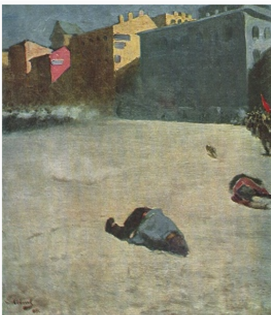
«Расстрел демонстрации в 1905 году». Художник С. В. Иванов. 1905. Центральный музей современной истории России (Москва).

Однако революционный террор и ответные репрессии продолжались. В целом в 1905–07, по подсчётам историков, жертвами революц. террора стали более 13 тыс. чел.; в ходе карательных экспедиций (1905–06) и по решениям военно-окружных (1906–10) и военно-полевых (1906–07) судов убиты и казнены ок. 5 тыс. чел.