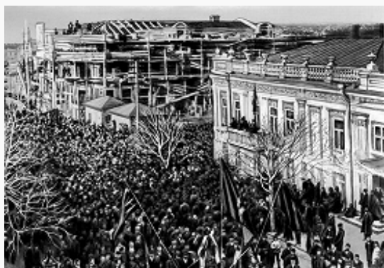
Демонстрация в Новороссийске. Фото. Декабрь 1905.

Многочисл. жертвы вызвали возмущение в обществе и резкий рост забастовочного движения (в 1905 бастовало ок. 3 млн. чел.).