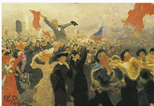
«17 октября 1905 года». Эскиз картины И. Е. Репина. 1906.

Революц. пропаганда подпитывалась финансовыми средствами из-за рубежа (в частности, в этом активно участвовал с осени 1904 япон. Генеральный штаб). Необычайно широкий размах принял террор против представителей власти (в окт. 1905 – апр. 1906 в результате терактов были убиты и ранены 3611 полицейских, чиновников и т. д.). Наивысший подъём революции – Декабрьские вооружённые восстания 1905 и самое крупное из них – Московское декабрьское восстание 1905 , подавленное под рук. Ф. В. Дубасова. В кон. 1905 – нач. 1906 восстаниями были охвачены Эстляндская и Лифляндская губернии, где происходили массовые убийства помещиков-остзейцев и нападения на гарнизоны, а также города вдоль Транссибирской магистрали , по которой после окончания рус.-япон. войны возвращалась в Европ. Россию деморализованная армия. В Прибалтике восстания были подавлены карательными экспедициями частей Петерб. воен. округа (145 чел. из числа восставших убиты в ходе вооруж. столкновений, 356 чел. расстреляны), в Сибири – отрядами генералов барона А. Н. Меллер-Закомельского (35 революционеров убиты, 70 чел. ранены) и П. К. фон Ренненкампа (137 чел. преданы воен. суду, из них расстрелян 21 чел., оправданы 29 чел., остальные осуждены на каторгу, ссылку и тюремное заключение).