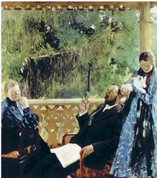
Б. М. Кустодиев. Портрет семьи Поленовых («Семейный портрет»). 1904–05. Художественно-исторический музей (Вена).

словаре Ф. А. Брокгауза и И. А. Ефрона» раздел геологии и палеонтологии (автор св. 200 статей). Чл. Геологич. части при Кабинете Е. И. В. (с 1894). В 1882 (совм. с Н. А. Соколовым) и в 1894–1911 участвовал в геологич. экспедициях по Алтаю, в 1883–86 проводил петрографич. исследования на дачах Нижнетагильского, Нижнесалдинского и Алапаевского заводов на Урале, в 1887 геологич. исследования в бассейне р. Юг в Устюжском у., в 1888–89 геолого-почвенные изыскания в Хорольском и Константиноградском уездах Полтавской губ., в 1891 обследовал окрестности С.-Петербурга и долину р. Нева, в 1892–93 открыл и исследовал новые месторождения золота в Северо-