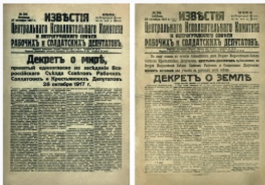
Первые декреты советской власти.

В ночь на 27 окт. (9 нояб.) они утвердили Декрет о земле , а также состав Врем. рабочего и крестьянского правительства – СНК Рос. республики под председательством Ленина (вошли только большевики; левые эсеры, образовавшие самостоят. левых социалистов-революционеров партию , первоначально отказались, в конце ноября / начале декабря согласились участвовать в работе СНК, но вышли из него в марте 1918; меньшевики-интернационалисты отклонили предложение войти в СНК). Тогда же был избран новый руководящий орган Советов рабочих и солдатских депутатов, за ним сохранялось назв. ВЦИК (101 чел., из них – 62 большевика, 29 левых эсеров, 6 меньшевиков-интернационалистов, 4 представителя др. левых групп). Его первыми председателями стали большевики Л. Б. Каменев – до 8(21) нояб., затем Я. М. Свердлов . Одним из первых декретов СНК стал Декрет о печати от 27 окт. (9 нояб.), в соответствии с которым подлежали закрытию оппозиционные СНК органы печати. Новый состав ВЦИК 2(15) нояб. принял Декларацию прав народов России , провозгласив, в частности, право народов на свободное самоопределение, вплоть до отделения и образования самостоят. государства. На созванном позднее 2-м Всерос. съезде Советов крестьянских депутатов [26 нояб. (9 дек.) – 10(23) дек., Петроград] был переизбран также Исполком Всерос. совета крестьянских депутатов, в который вошли гл. обр. левые эсеры и большевики, деятельность предыдущего Исполкома признана «преступной».