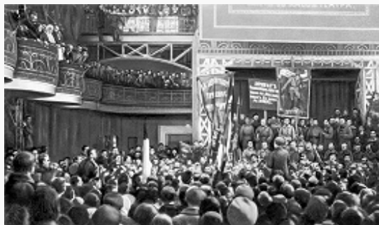
Первый Всероссийский съезд Советов крестьянских депутатов. Петроград. Фото 1917.

совета крестьянских депутатов [28 мая (10 июня)] и Всероссийский центральный исполнительный комитет (ВЦИК) Советов [16(29) июня], к которому от Петросовета перешла роль всерос. центра Советов рабочих и солдатских депутатов. Оба органа возглавлялись гл. обр. меньшевиками и эсерами.