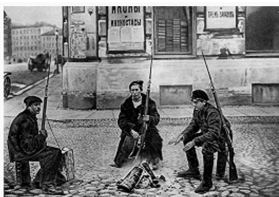
Красногвардейский пикет на улице Петрограда. Октябрь 1917. Фото.

Критич. ситуация на фронте, внутривластный кризис активизировали практически все политич. и обществ. силы. Ленин, возмущённый позицией ЦК большевиков, затягивавшего решение о начале вооруж. восстания, и опасавшийся, что партия может потерять шанс взять власть, нелегально вернулся в Петроград из Финляндии, пригрозив выходом из состава ЦК, чтобы иметь свободу агитации в низовых парт. организациях. 10(23)