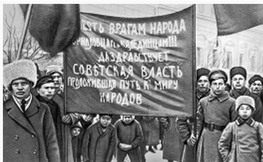
Демонстрация рабочих и солдат Петрограда в поддержку

В ночь на 27 окт. (9 нояб.) они утвердили Декрет о земле , а также состав Врем. рабочего и крестьянского правительства – СНК Рос. республики под председательством Ленина (вошли только большевики; левые эсеры, образовавшие самостоят. левых социалистов-революционеров партию , первоначально отказались, в конце ноября / начале декабря согласились участвовать в работе СНК, но вышли из него в марте 1918; меньшевики-интернационалисты отклонили предложение войти в СНК). Тогда же был избран новый руководящий орган Советов рабочих и солдатских депутатов, за ним сохранялось назв. ВЦИК (101 чел., из них – 62 большевика, 29 левых эсеров, 6 меньшевиков-интернационалистов, 4 представителя др. левых групп). Его первыми председателями стали большевики Л. Б. Каменев – до 8(21) нояб., затем Я. М. Свердлов . Одним из первых декретов СНК стал Декрет о печати от 27 окт. (9 нояб.), в соответствии с которым подлежали закрытию оппозиционные СНК органы печати. Новый состав ВЦИК 2(15) нояб. принял Декларацию прав народов России , провозгласив, в частности, право народов на свободное самоопределение, вплоть до отделения и образования самостоят. государства. На созванном позднее 2-м Всерос. съезде Советов крестьянских депутатов [26 нояб. (9 дек.) – 10(23) дек., Петроград] был переизбран также Исполком Всерос. совета крестьянских депутатов, в который вошли гл. обр. левые эсеры и большевики, деятельность предыдущего Исполкома признана «преступной».