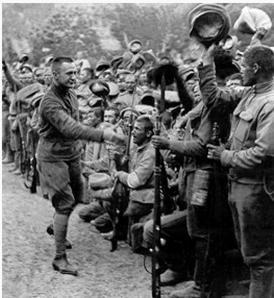
Встреча А. Ф. Керенского с солдатами российской армии. Весна 1917. Фото.

На своей 7-й Всероссийской конференции 24 апр. (7 мая) большевики призвали рабочих вооружаться, хотя Исполком Петросовета и осуждал эту меру. Начался процесс формирования Красной гвардии в Петрограде. По инициативе Ленина, который, назвав слово «социал-демократ» неверным и «научно неправильным», впервые выдвинул предложение переименовать партию в коммунистическую, большевики стали отделяться от меньшевиков и фактически образовали свою партию [в историографии за ней утвердилось назв. РСДРП(б)], поддержавшую на конференции ленинский курс на подготовку условий для перехода власти в руки пролетариата.