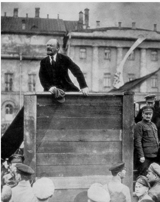
В. И. Ленин выступает перед войсками. Справа у входа на трибуну Л. Д. Троцкий, за ним Л. Б. Каменев. Москва. 5. 5.1920.

Одержав победу в Гражд. войне 1917–1922, большевики установили власть в форме Советов на б. ч. территории быв. Рос. империи (за исключением Польши, Финляндии, Литвы, Латвии, Эстонии, Бессарабии, Зап. Украины и Зап. Белоруссии) и приступили к реализации своей программы.