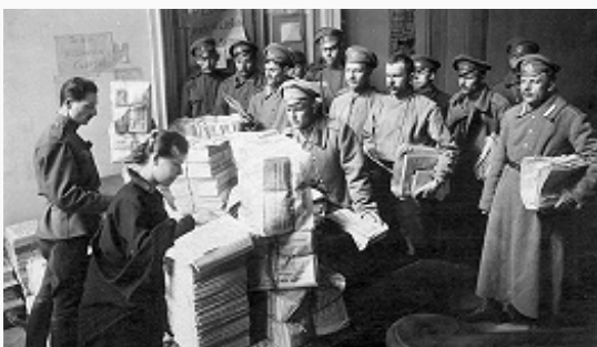
Раздача газеты «Известия» солдатам. Петроград. Март 1917. Фото.

Падение монархии во время Февр. революции 1917 сопровождалось многочисл. революц. инициативами нар. масс, Советов (в столице – Петросовета ) и Врем. правительства, принявшего на себя исполнит.-распорядит. и законодат. власть. Образовывались городские, волостные, уездные, губернские общественные исполнительные комитеты , представлявшие практически все слои населения. В конце февраля и особенно весной по всей стране