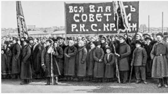
Демонстрация в Чите в поддержку советской власти. Февраль 1918.