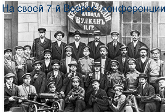
Отряд Красной гвардии завода «Вулкан». Петроград. Фото 1917.

На своей 7-й Всероссийской конференции 24 апр. (7 мая) большевики призвали рабочих вооружаться, хотя Исполком Петросовета и осуждал эту меру. Начался процесс формирования Красной гвардии в Петрограде. По инициативе Ленина, который, назвав слово «социал-демократ» неверным и «научно неправильным», впервые выдвинул предложение переименовать партию в коммунистическую, большевики стали отделяться от меньшевиков и фактически образовали свою партию [в историографии за ней утвердилось назв. РСДРП(б)], поддержавшую на конференции ленинский курс на подготовку условий для перехода власти в руки пролетариата.