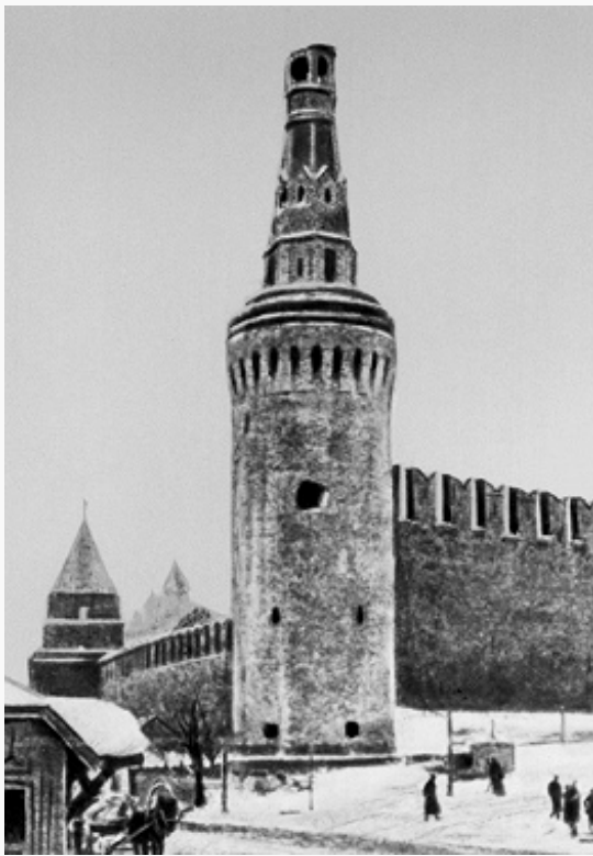
Беклемишевская башня Московского Кремля со следами разрушения после обстрела красногвардейцами. Ноябрь 1917. Фото.

правительством. ВЦИК Советов объявил съезд «незаконным частным совещанием большевиков». Для сопротивления большевикам при Петрогр. гор. думе образован Комитет спасения родины и революции , в который вошли представители столичной гор. думы, Предпарламента, ВЦИК, Исполкома Всерос. совета крестьянских депутатов; меньшевики, эсеры, нар. социалисты и др. Одновременно в 2 ч 10 мин ночи 26 окт. (8 нояб.) ок. 400 чел. из отрядов ПВРК во главе с В. А. Антоновым-Овсеенко проникли в Зимний дворец, арестовали министров Врем. правительства и отправили их в Петропавловскую крепость. Незначит. часть делегатов 2-го Всерос. съезда Советов (эсеры, меньшевики, в т. ч. меньшевики-интернационалисты) покинула съезд в знак