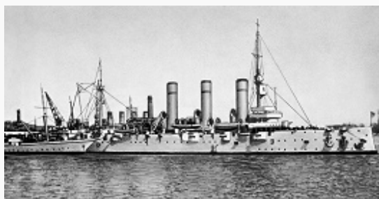
Крейсер «Аврора» во время ремонта у стенки Франко-русского завода. Петроград. 1917.

Гос. банка. По приказу ПВРК в Неву вошли неск. кораблей Балт. флота. Радиостанция подошедшего к Николаевскому мосту крейсера «Аврора» передала воззвание Ленина «К гражданам России», в котором он, опережая события, сообщал, что Врем. правительство низложено, а гос. власть перешла в руки ПВРК. В 11 ч Керенский выехал в Псков в штаб Сев. фронта за воен. помощью. Тем же утром на заседании ЦК большевиков в Смольном обсуждался вопрос о возможном составе будущего правительства и принято решение назвать его Советом народных комиссаров (СНК). Во 2-й половине дня Ленин, не дожидаясь открытия 2-го Всерос. съезда Советов рабочих и солдатских депутатов, выступил перед депутатами Петросовета и объявил: «Рабочая и крестьянская революция, о необходимости которой всё время говорили большевики, свершилась».