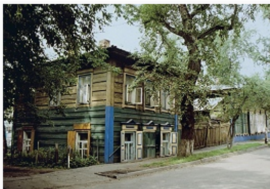
Жилая застройка старого города.