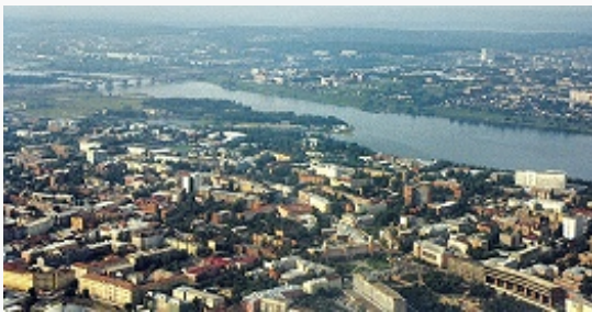
Иркутск. Панорама города.

Авторы: А. В. Дулов (история), Н. Ю. Замятина (экономика), Л. К. Масиэль Санчес, П. С. Павлинов (архитектура)