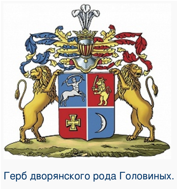
Герб дворянского рода Головиных.

ГОЛОВИНЫ, рус. дворянский и графский род, ветвь рода Ховриных, ведущего своё происхождение от Стефана Васильевича, выехавшего из Сурожа (ныне Судак) в Москву в нач. 15 в. Родоначальник Г. – его правнук Иван Владимирович Ховрин Голова (? – после 1503), крестник вел. кн. московского Ивана III Васильевича, в 1473 вместе с отцом В. Г. Ховриным руководил постройкой Успенского собора Московского Кремля, позднее, по всей видимости, принял постриг в Симоновом мон.