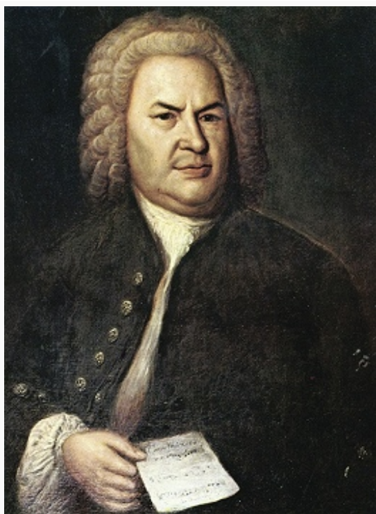
И. С. Бах. Портрет работы Э. Г. Хаусмана (1746). Музей истории

связанных с пребыванием в Лейпциге членов монаршей семьи, с датами их рождения, печальными и радостными событиями и т. д.). Обстоятельства и особенности характера Б., часто отлучавшегося из Лейпцига, приводили к длительным (порой многолетним) конфликтам с ректоратом, церковным и университетским руководством, с городским советом. Вынужденный отстаивать свои права, композитор заручился поддержкой Фридриха Августа I (в 1725) и его сына Фридриха Августа II (в 1733); последний присвоил Б. в 1736 титул придворного композитора в ответ на присланные ему в дар две части (Kyrie и Gloria) мессы. Покровителем Б. был также российский посланник в Дрездене граф Г. К. Кайзерлинг. В Лейпциге написана бóльшая часть кантат, мессы, «страсти», оратории. В мае 1747 Б. гостил в Потсдаме у Фридриха II Великого ; по возвращении в Лейпциг на тему, предложенную королём, создал серию контрапунктических вариаций «Музыкальное приношение». Интерес композитора к тонкостям контрапунктической техники усилился в последние годы благодаря организации в 1738 его учеником Л. Мицлером Общества музыкальных наук, членом которого Б. стал в июне 1747. В конце 1740-х гг. Б. стал терять зрение. Весной 1749 его состояние резко ухудшилось, и спустя год, после двух неудачных операций, композитора не стало.