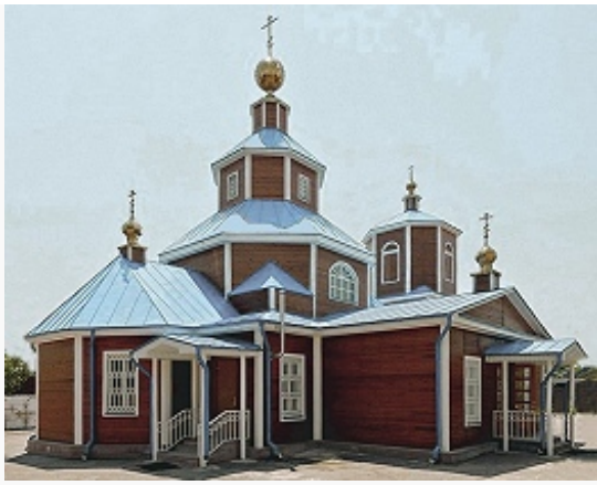
Церковь Святителя Николая в Георгиевске. Перевезена с реки Хопёр в 1780.

строительства – дерев. ц. Свт. Николая в Ессентуках, 1825–27, и др.). В стиле классицизма построены адм. здания в Ставрополе. В церквах классицизм сочетался с архаич. элементами (8-гранные барабаны): Спасо-Преображенская в с. Новоселицкое (1820–25), Св. Димитрия Солунского в с. Безопасное (1832). На курортах строятся здания в духе неоренессанса , неоготики , мавританского стиля и др.; мн. сооружены в 1840–1860-е гг. по проектам англ. арх. С. И.