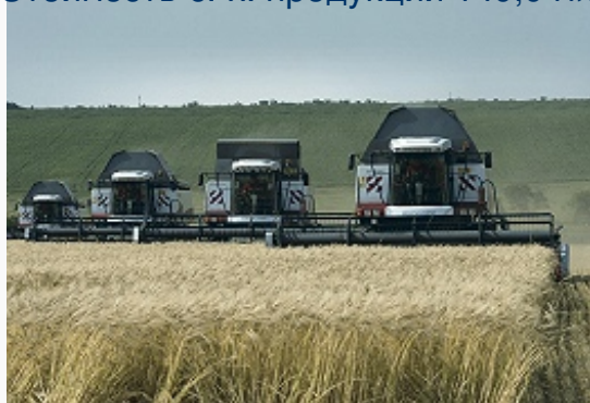
Уборка зерновых (Арзгирский район).

Стоимость с.-х. продукции 149,0 млрд. руб. (2014), на долю растениеводства