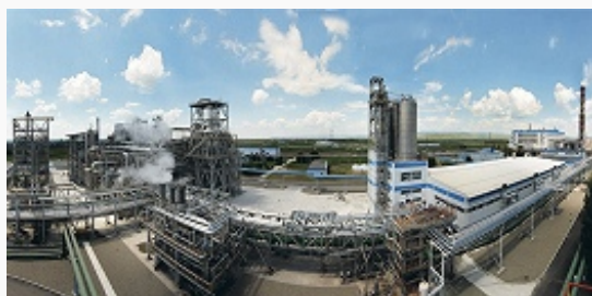
АО «Невинномысский Азот» Вид предприятия «Невинномысский Азот» (г. Невинномысск).

Объём пром. продукции 269,5 млрд. руб. (2014); из них 69,7% приходится на обрабатывающие произ-ва, 26,9% – произ-во и распределение электроэнергии, газа и воды, 3,4% – добычу полезных ископаемых. Отраслевая структура обрабатывающих производств (%): пищевкусовая пром-сть 38,6, химическая пром-сть 31,0, машиностроение 13,4, произ-во стройматериалов 8,0, металлургия и металлообработка 4,4, лёгкая пром-сть 1,2, др. отрасли 3,4.