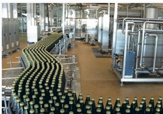
Розлив минеральной воды на предприятии «Нарзан» (г. Кисловодск). ОАО «Нарзан»

артезианской воды), «Кавминводы» (пос. Новотерский; розлив минер. воды «Новотерская целебная» и «Новотерская»). Действуют св. 30 предприятий объединения «Ставропольвиноградпром», в т. ч. «Прасковейское» (с. Прасковея; вина, коньяки), «Вина Прикумья 2000» (пос. Терек; возделывание винограда, переработка, розлив вина), производств. комплекс группы компаний «Альвиса» (Ставропольский винно-коньячный завод, Минераловодский завод виноградных