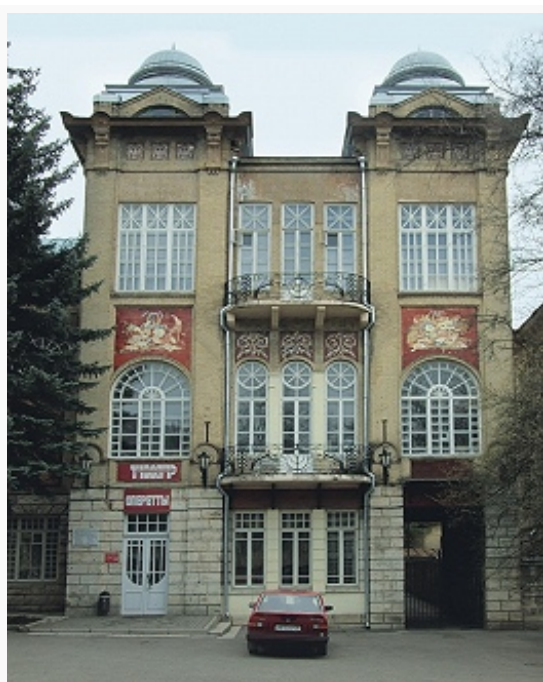
Здание театра оперетты в Пятигорске. 1914–15. Архитектор А.И. Кузнецов.

Пятигорске (1912–14, арх. М. М. Перетяткович) и Ессентуках (1913–15, арх. Е. Ф. Шретер). В 1903 построена ГЭС в Ессентуках (одна из первых в стране; ныне в здании – музей).