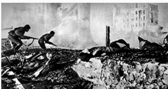
Бой на улице Сталинграда. Фото 1942.

левого крыла Воронежского фронтов, Волжская воен. флотилия, Сталинградский корпусной р-н ПВО. Герм. командование для наступления на Сталинград первоначально выделило из состава группы армий «Б» 6-ю полевую армию (ок. 270 тыс. чел., 3 тыс. орудий и миномётов, ок. 500 танков; команд. – ген.-полк., с 31.1.1943 ген.-фельдм. Ф. Паулюс ), которую поддерживала авиация 4-го возд. флота (до 1,2 тыс. боевых самолётов). 31 июля сюда была переброшена с сев.-кавк. направления 4-я танковая армия.