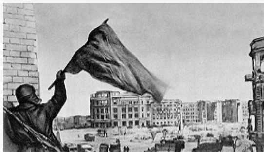
Красное знамя над освобождённым Сталинградом. Февраль 1943.

наступление войска Сталинградского фронта (ген.-полк. А. И. Ерёменко ), прорвав оборону рум. 4-й армии. 23.11.1942 кольцо окружения замкнулось. В котле оказались 22 дивизии и более 160 отд. частей противника. Протяжённость внешнего фронта окружения составляла 450 км. Расстояние между внешним и внутренним фронтами окружения колебалось в пределах 20–100 км. 12 дек. герм. командование, пытаясь деблокировать свои окружённые войска, начало операцию «Винтергевиттер» («Зимняя гроза»), однако герм. танковые дивизии армейской группы «Гот» (из состава групп армий «Дон») были вскоре остановлены на р. Мышкова, а затем разгромлены (см. Котельниково ). По решению Ставки ВГК 25 нояб. – 20 дек. силами войск Зап. и Калининского фронтов проведена отвлекающая операция «Марс» (см. в ст. Ржевские операции 1942–43 ), сковавшая крупные силы противника и не позволившая использовать их под Сталинградом. 10.1.1943 войска Донского фронта начали операцию «Кольцо» по уничтожению окружённого противника, которая успешно завершилась 2 февр. Были разгромлены 22 герм. дивизии и 149 отд. частей, взяты в плен св. 91 тыс. чел., в т. ч. 24 генерала.