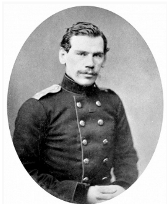
Л.Н. Толстой – поручик артиллерии. Фото 1854.

присущее романтическому «кавказской» прозе в духе А. А. Бестужева (Марлинского), и романтическое представление о благородстве горцев.