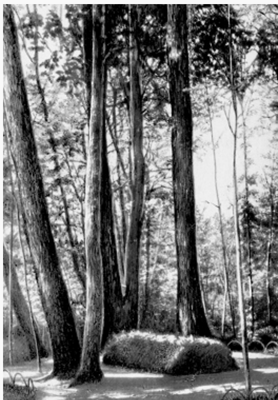
Могила Л.Н. Толстого в Ясной Поляне.

кн. «Путь жизни» (1910, опубл. в 1911, посм.).