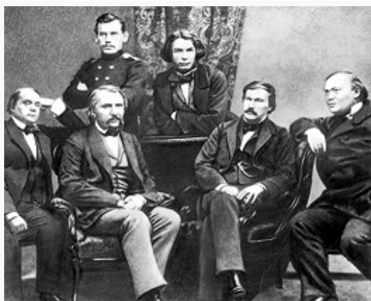
Сотрудники журнала «Современник»: сидят (слева направо) И. А. Гончаров, И. С. Тургенев, А. В. Дружинин, А. Н. Островский; стоят – Л. Н. Толстой, Д. В. Григорович. С.-Петербург. Фото 1856.

1.11.1843 Т. познакомился с певицей П. Виардо-Гарсия , любовь к которой изменила его жизнь. В 1845 Т. вышел в отставку; с нач. 1847 по июнь 1850 жил за границей (в Германии и Франции), стремясь быть вблизи возлюбленной (которая была замужем). Драма, испытанная писателем, отразится позднее в его трактовке любви как чувства исключительного высокого и при этом или неразделённого, или обречённого на страдания или утрату любимой. Во время пребывания за границей Т. часто встречался с А. И. Герценом , познакомился с писателями Ж. Санд , П. Мериме , А. де Мюссе , композиторами Ф. Шопеном и Ш. Гуно .