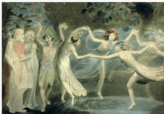
У. Блейк. «Оберон, Титания и Пак с танцующими феями». Иллюстрация к пьесе У. Шекспира «Сон в летнюю ночь». 1786. Галерея Тейт (Лондон).

С сер. 19 в. стали появляться теории, подвергавшие сомнению авторство Ш. и называвшие в качестве претендентов образованных аристократов – графов Оксфорда, Ретленда, Дерби и др. Выдвигалось предположение, что автором пьес Ш. был его предшественник К. Марло . Попытки опровергнуть авторство Ш. предпринимаются доныне, однако большинство учёных едины в своём признании его авторства.