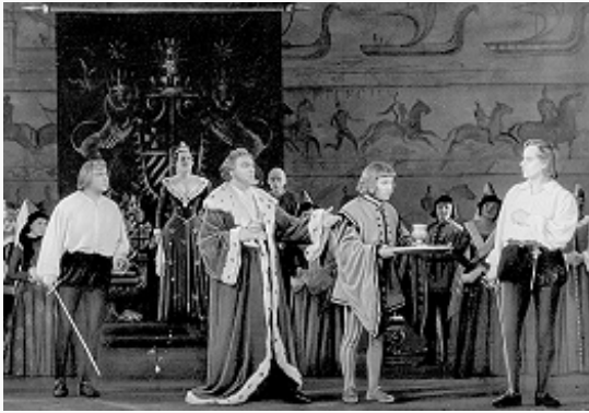
Сцена из спектакля по пьесе У. Шекспира «Гамлет» в Московском академическом театре имени Вл. Маяковского. 1955.

глубоки, чем те, деяниям которых и посвящена хроника. Так, сэр Джон Фальстаф, благодаря своей сценической популярности, после хроник («Генрих IV», ч. 1 и ч. 2; «Генрих V») перешёл в комедию «Виндзорские насмешницы» («The merry wives of Windsor», 1597–98, опубл. в 1602). В тетралогии не входят хроники «Король Иоанн» («King John», 1596, опубл. в 1623) и «Король Генрих VIII».