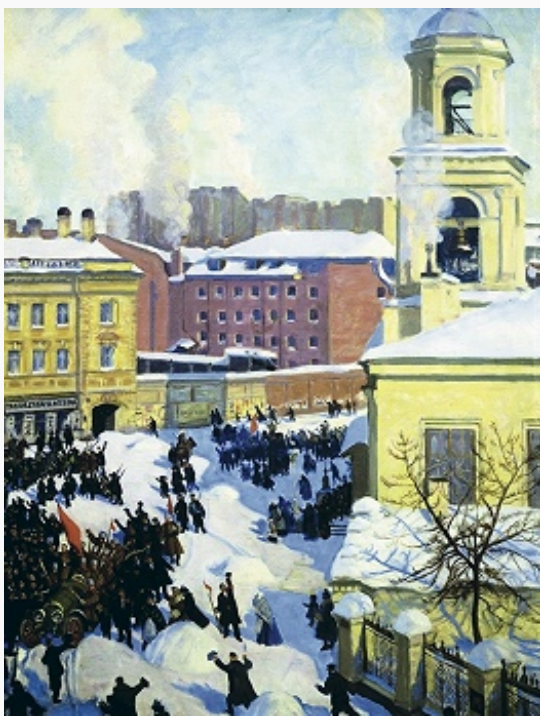
«27 февраля 1917». Художник Б. М. Кустодиев. 1917. Третьяковская

ФЕВРАЛЬСКАЯ РЕВОЛЮЦИЯ 1917, буржуазно-демократич. революция в России, в ходе которой пала монархия и фактически был установлен республиканский строй. Ход событий в значит. степени определили трудности воен. времени 1-й мировой войны, а также союз либеральных, демократич. и революц. сил и даже великокняжеской оппозиции, имевших разные конечные цели (уже весной 1917 пути всех их резко разошлись). Непосредств. причинами Ф. р. стали: нарастающая инфляция, падение к 1917 покупательной способности рубля до 27 коп., перебои со снабжением населения крупных городов предметами первой необходимости (сахар, спички, керосин, ткань, обувь), а главное – хлебом, запасы которого в стране были, однако поставки из Зауралья в центр. районы осложнялись в связи с недостатком транспорта, использовавшегося гл. обр. для нужд фронта.