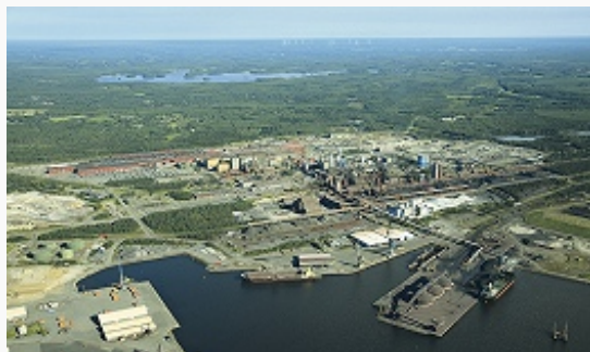
Металлургический завод в Раахе.

строится энергоблок мощностью 1600) и «Loviisa» (1020, обл. Уусимаа). ГЭС «Imatra» на р. Вуокса (170, обл. Этеля-Карьяла) и др. Активно развивается альтернативная энергетика – ветровая, геотермальная, на основе биомассы и бытовых отходов [ТЭС «Alholmens Kraft» в обл. Похьянмаа – 2-я в мире по мощности среди станций такого типа (265 МВт)].