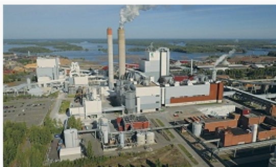
Целлюлозно-бумажный комбинат компании «UPM-Kymmene» в Лаппеэнранте.

Добыча (тыс. т, 2013): известняка ок. 2319,0, пирита 990,0, доломита 81,0. Произ-во цемента 1,4 млн. т (2013) на заводах в городах Парайнен (мощность 1,1 млн. т в год; обл. Варсинайс-Суоми) и Лаппеэнранта (0,6; обл. Этеля-Карьяла) (оба – в составе единственного нац. производителя – компании «Finnsementti»). Выпуск изоляционных материалов из натурального камня и сэндвич-панелей (компания «Pargos»). Произ-во гашёной извести 450,0 тыс. т (2013; в т. ч. в Лаппеэнранте).