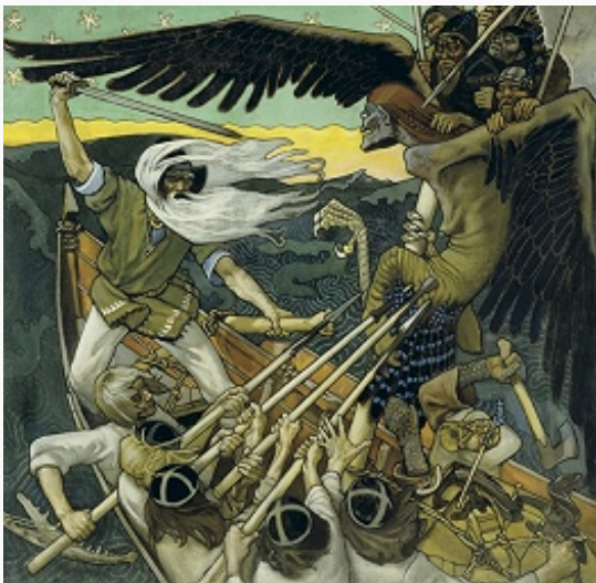
А. Галлен-Каллела. «Защита Сампо». 1896. Художественный музей (Турку).

В русле живописи романтизма работали в нач.