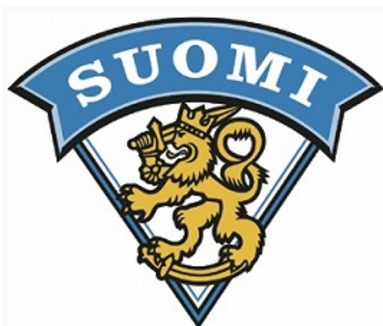
Эмблема сборной команды Финляндии по хоккею с шайбой.

Нац. олимпийский к-т Ф. создан и признан МОК в 1907; в 1908 и 1912 сборная команда Ф. выступала на Олимпиадах в Лондоне и Стокгольме самостоят. командой. Первую золотую медаль в истории фин. спорта выиграл борец классич. стиля (ныне греко-римская борьба) В. Векман (весовая категория до 93 кг). На Олимпийских играх (1908–2016) завоёваны 101 золотая, 84 серебряные, 118 бронзовых медалей; на Олимпийских зимних играх (1924–2014) выиграны 42 золотые, 62 серебряные, 57 бронзовых медалей. Наибольшего успеха добились представители лёгкой атлетики (48, 35, 31), борьбы (26, 28, 29), лыжных гонок (20, 24, 32), прыжков с трамплина (10, 8, 4), спортивной гимнастики (8, 5, 12) и скоростного бега на коньках (7, 8, 9). Среди выдающихся фин. спортсменов, выигравших 3 и более золотых олимпийских медалей, – П. Нурми (9