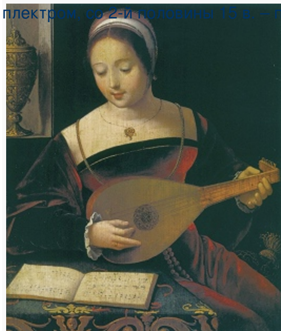
«Мадлен, играющая на лютне».

Картина работы неизвестного фламандского мастера 16 в. Кунстхалле (Гамбург).