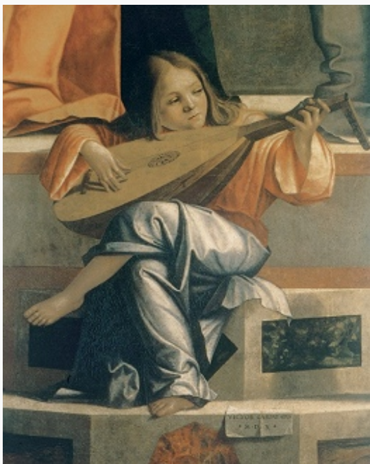
В. Карпаччо. «Сретение». Фрагмент. 1510. Галерея Академии (Венеция).

ЛЮТНЯ (польск. lutnia , от итал. liuto , от араб. аль'уд, букв. – дерево), струнный щипковый инструмент ( хордофон ), распространённый в Европе в 15–17 вв.