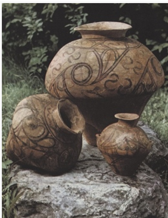
Керамика трипольской культуры. 4-е тыс. до н. э. Исторический музей (Москва).

забрасывались, и население уходило на новые земли, постепенно расселившись вплоть до среднего течения Днепра.