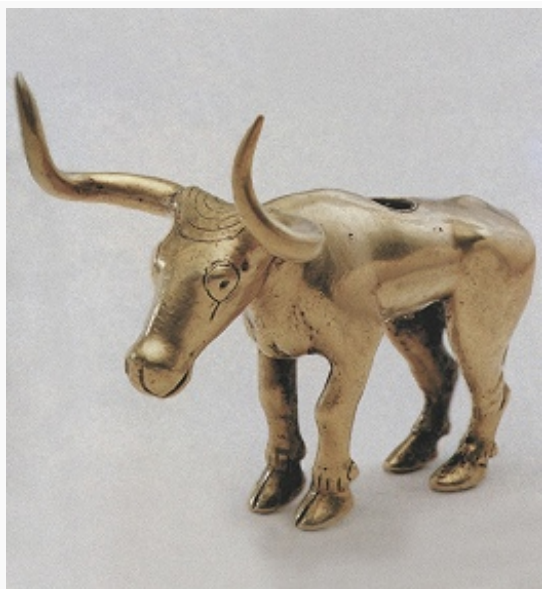
Фигурка быка из Майкопского кургана (Майкоп). Золото. 1-я пол. 3-го тыс. до н. э. Исторический музей (Москва).

хозяйства. Под их влиянием, а возможно, и в связи с ухудшением климатических условий развитие раннеземледельческих центров прерывается. На смену им в ряде районов приходят культуры с комплексным скотоводческо-земледельческим хозяйством. В Северо-Западном Причерноморье под давлением степных скотоводческих групп земледельческая трипольская культура переживает глубокую трансформацию, некоторые из возникших на её основе культур (усатовская культура) по всем признакам, кроме расписной керамики, приближаются к степным курганным культурам.