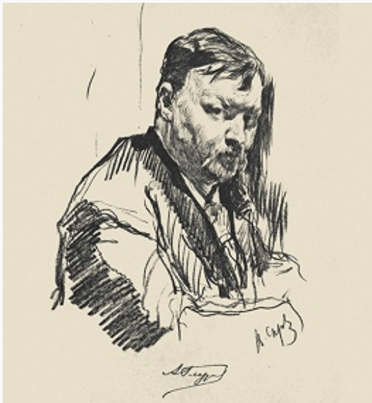
А. К. Глазунов. Портрет работы В. А. Серова. Литография. 1899.

ГЛАЗУНОВ Александр Константинович [29.7(10.8).1865, С.-Петербург – 21.3.1936, Нёйи-сюр-Сен, близ Парижа; в 1972 прах перенесён в некрополь Александро-Невской лавры в Ленинграде], российский композитор, дирижёр, педагог, народный артист Республики (1922). Из семьи книгоиздателей Глазуновых . В 1883 окончил 2-е реальное училище в Санкт-Петербурге. Получил домашнее музыкальное образование, с 1879 занимался у М. А. Балакирева и Н. А. Римского-Корсакова , оказавшего определяющее влияние на формирование Г. как композитора. Успех 1-